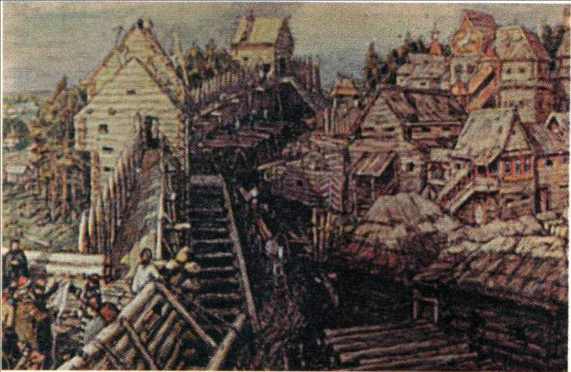
Основание Москвы. Постройка первых стен Кремля Юрием Долгоруким