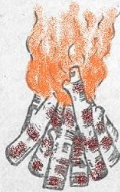
2 — «шалашик»