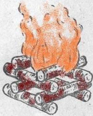
1 — «колодец»