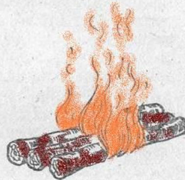
6 — «таежный-3»