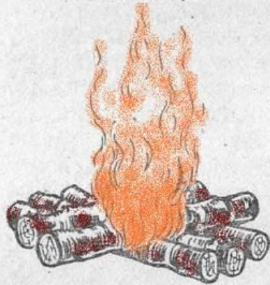
4 — «таежный-1»