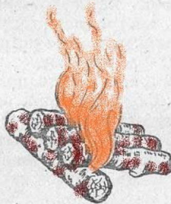
5 — «таежный-2»