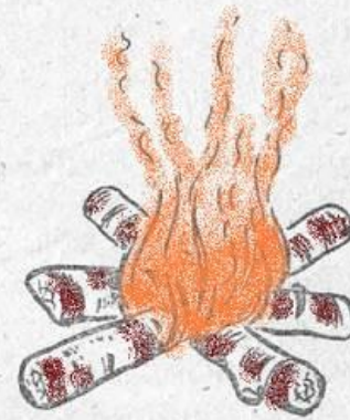
3 — «звездный»