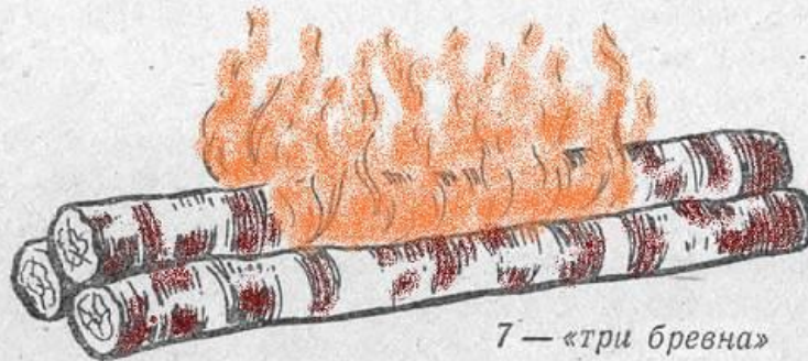
7 — «три бревна»