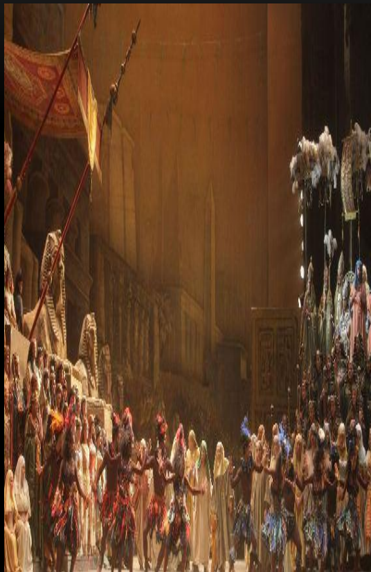
Фото сделано на опере «Аида» Джузеппе Верде

Сегодня Ла Скала по праву читается одним из самых известных театров мира. Это первое после Миланского собора, что осматривают прибывшие в Милан туристам.