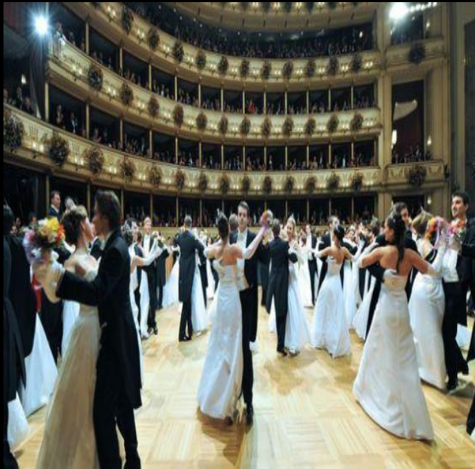
Венский бал – мероприятие со строгим дресс-кодом

Во Вторую мировую войну театр был частично разрушен, однако в 1955 году произошло его торжественное ре-открытие с оперой «Фиделио» Бетховена. По количеству представлений с Венской оперой не в состоянии сравниться ни один из других оперных театров. На протяжении 285 дней в году в этом здании на Рингштрассе ставится порядка 60 опер. Каждый год за неделю до первого дня Великого католического поста в здесь проходит Венский бал – мероприятие, занесенное в список нематериального культурного богатства, охраняемого ЮНЕСКО.