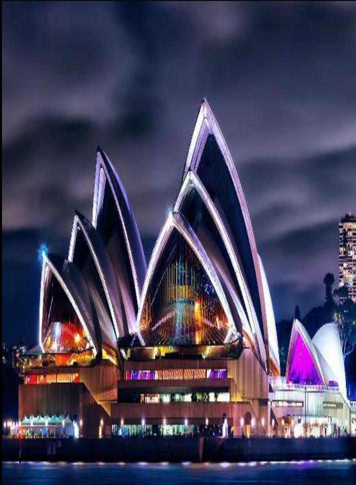
Сиднейский театр ночью

Общая площадь здания превышает два гектара. Внутри вы встретите без малого тысячу комнат, ведь здание является «штаб-квартирой» для Австралийской оперы, Сиднейского симфонического оркестра, Национального балета и Сиднейской театральной труппы.