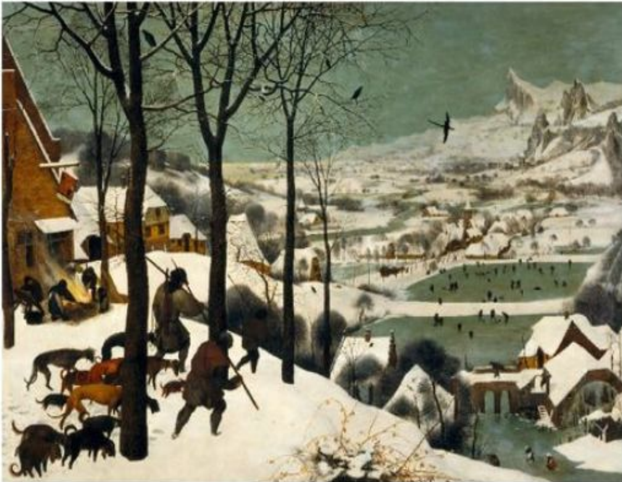
Питер Брейгель Старший. Охотники на снегу. 1565г.

Художники научились изображать расстояние, используя закономерности уменьшения предметов по мере их удаления от наблюдателя (законы линейной перспективы ). Т.е. чем предмет дальше расположен в пространстве, тем меньше его размеры.