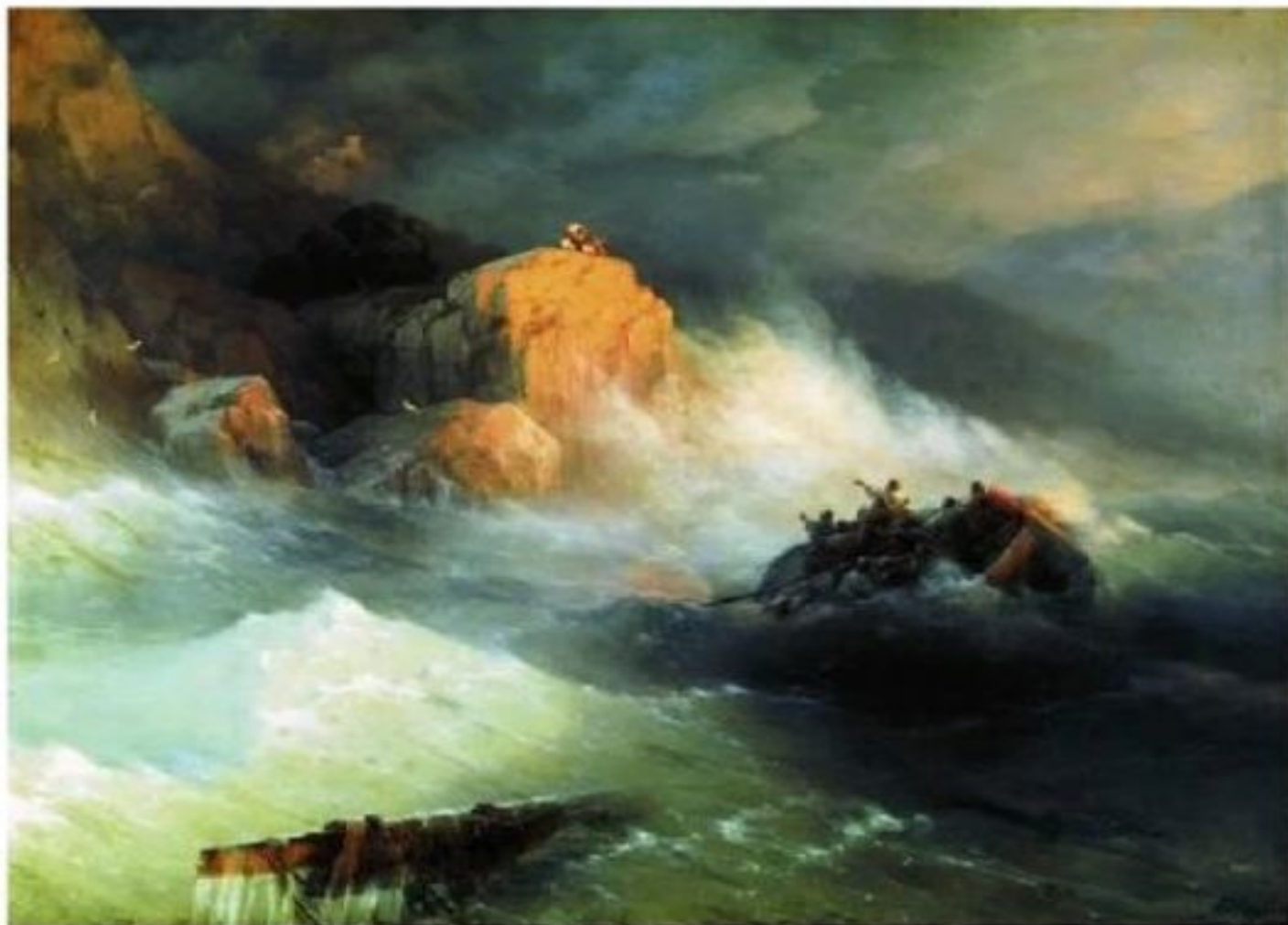
Иван Айвазовский. Кораблекрушение.

Марина – так называется морской пейзаж. А художников, творчество которых посвящено изображению морских просторов, принято называть художники-маринисты .