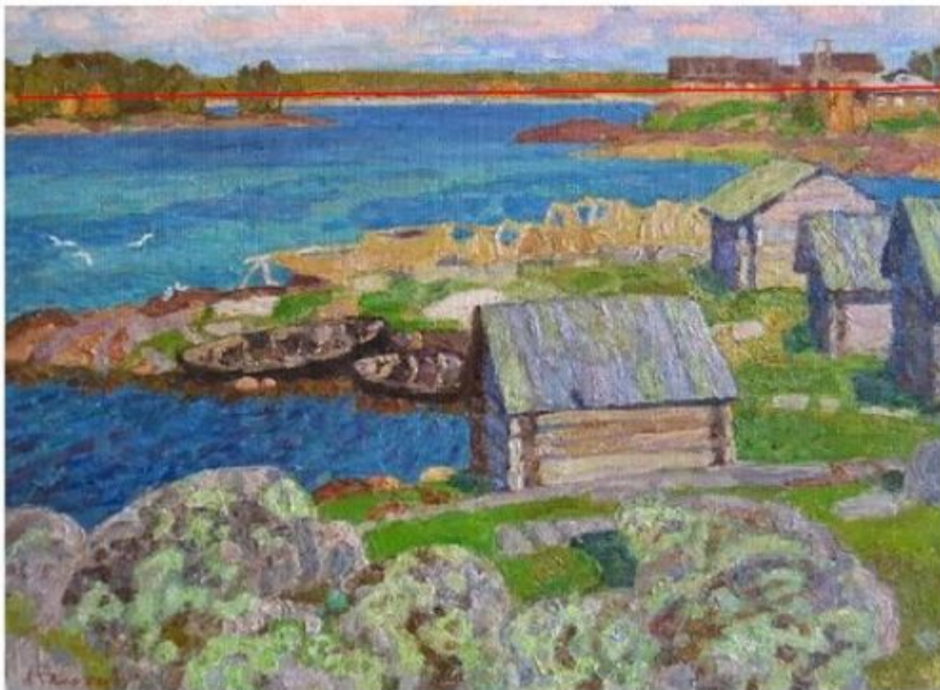
Николай Галахов. Деревенский пейзаж. 20 в.

Если сюжет вашего пейзажа располагается на земле, если вы хотите организовать глубокое, многоплановое пространство, то необходимо линию горизонта расположить выше середины.