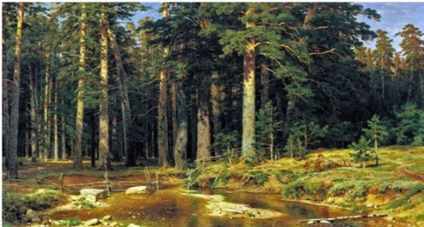
«Корабельная роща» Шишкин И.И.

(фр. Paysage А страна, местность) А— жанр (тема) изобразительного искусства), в котором основным предметом изображения является первозданная, либо в той или иной степени преобразённая человеком природа.