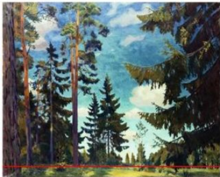
Аркадий Рылов. Предвечерняя тишина. 20 в.