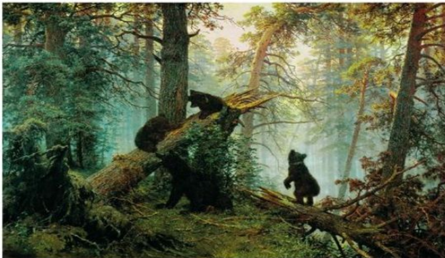
Шишкин И.И. Утро в сосновом бору.

Лесной пейзаж изображает природу без архитектурных построек.