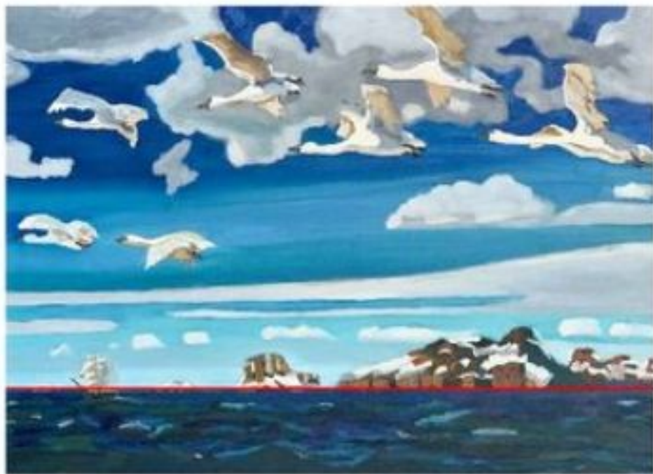
Аркадий Рылов. В голубом просторе. 20 в.

Ответ на этот вопрос зависит от вашего замысла. Если главным персонажем вашего пейзажа является небо или надо подчеркнуть высоту предметов на переднем плане, то проведите линию горизонта ниже середины.