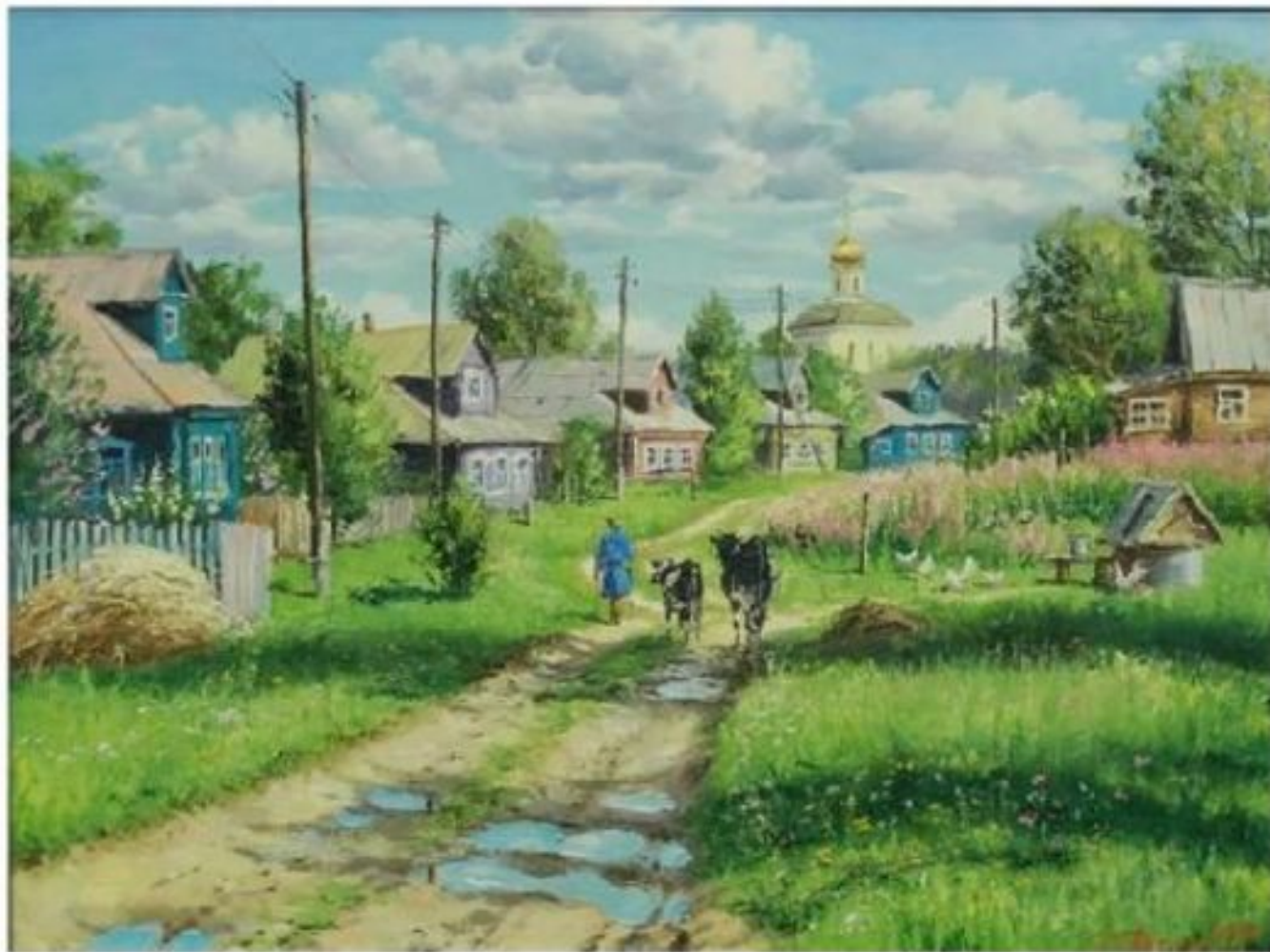
Олег Пятин. Деревенская Улочка. Колодец

Сельский (деревенский) пейзаж изображает природу и постройки деревенского типа.