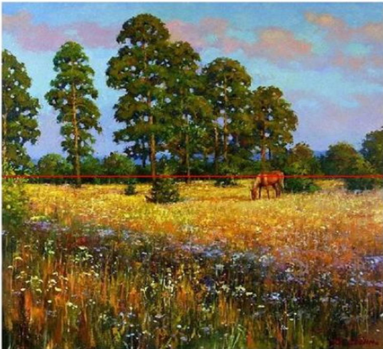
Дмитрий Лёвин. На опушке. 20 в.

И в случае, когда одинаково важны и земля и небо, линия располагается посередине.