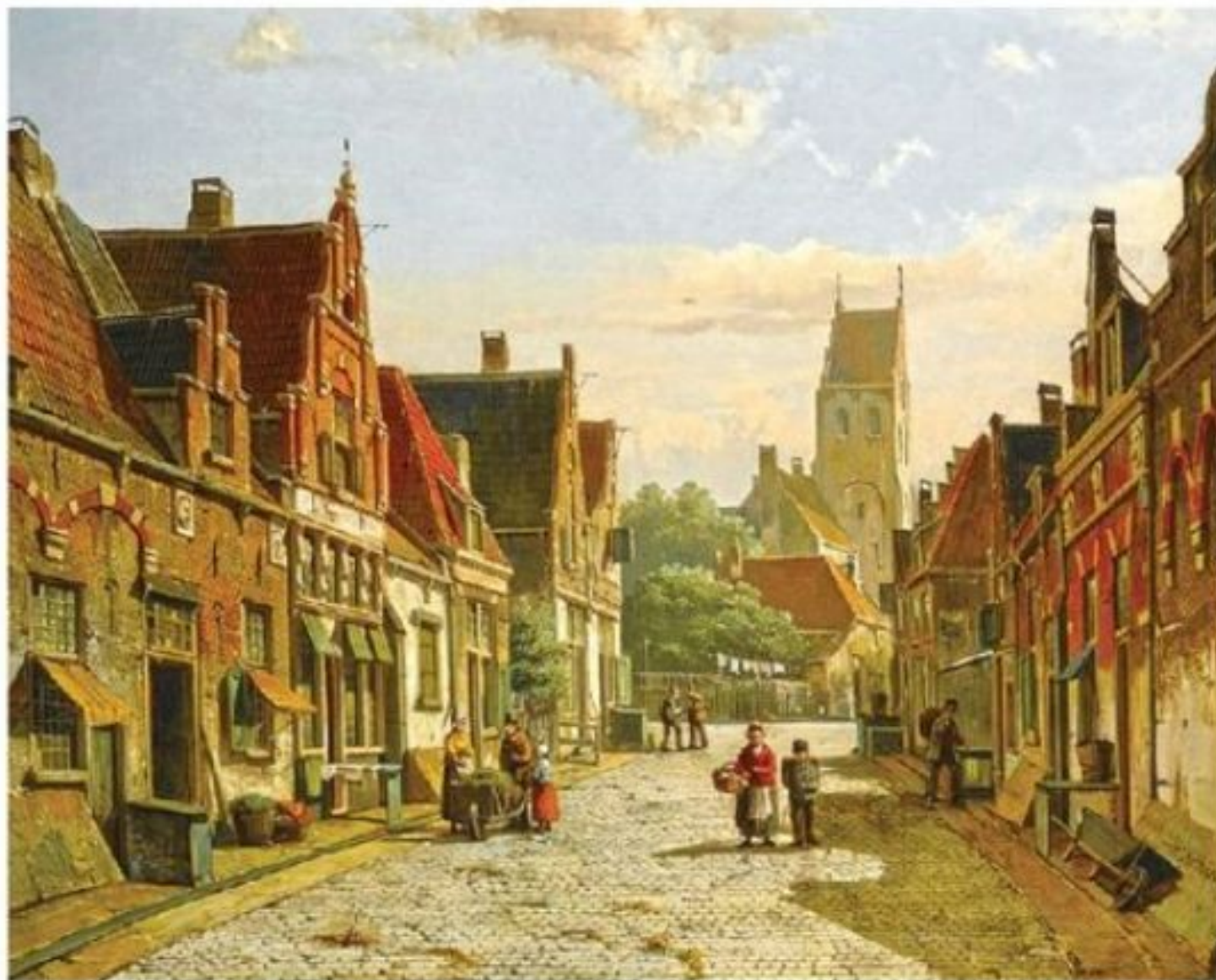
Виллем Куккук. Голландский город. 19 в.

На городском пейзаже мы видим городские улицы и здания.