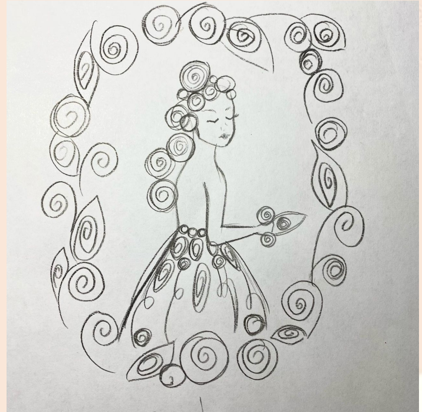
Создание эскиза будущего изделия