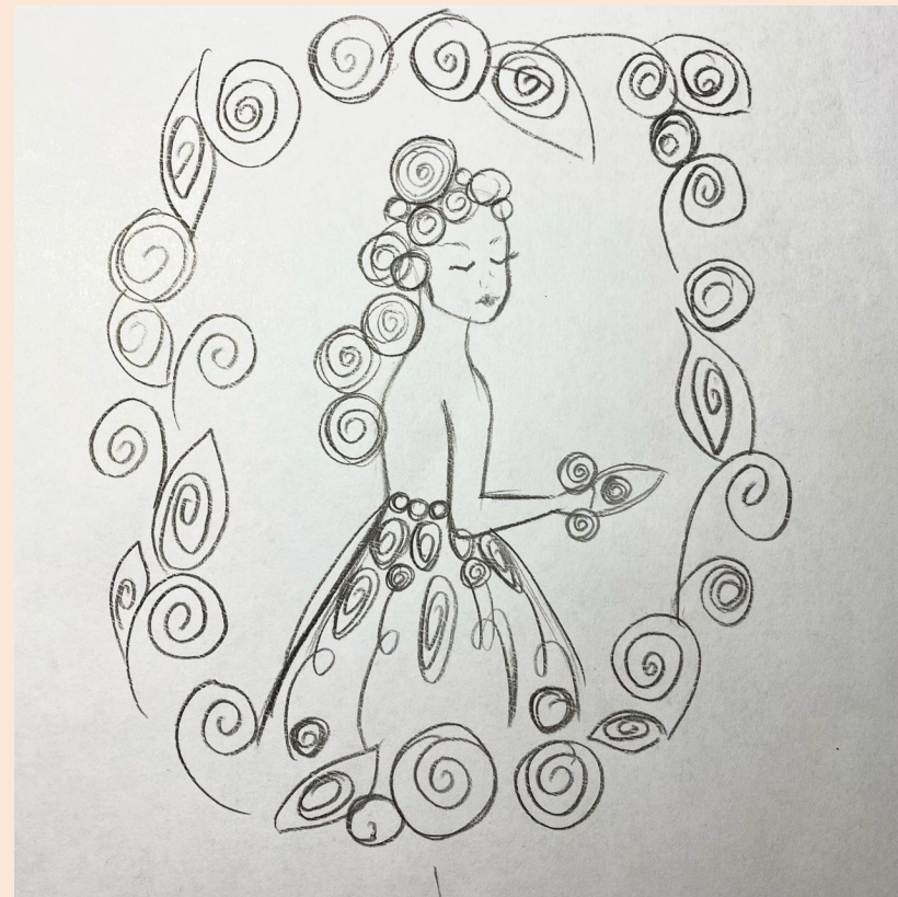
Создание эскиза будущего изделия