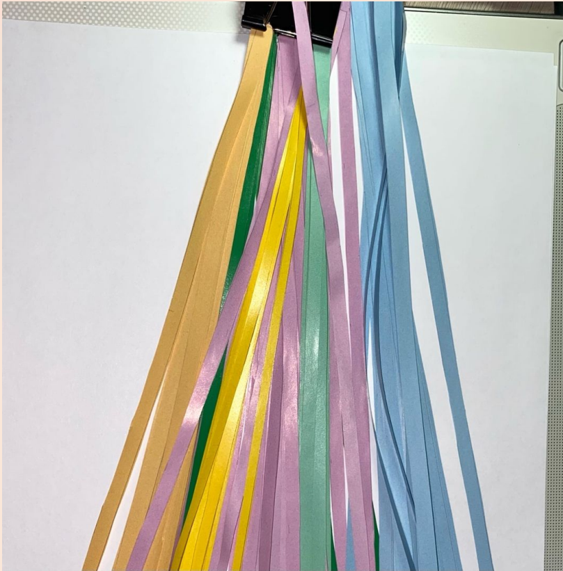
Нарезание бумажных лент