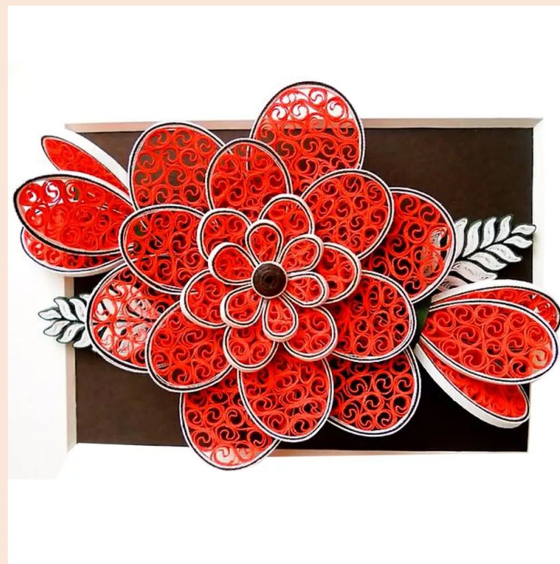
Бихайв (пчелиный улей)