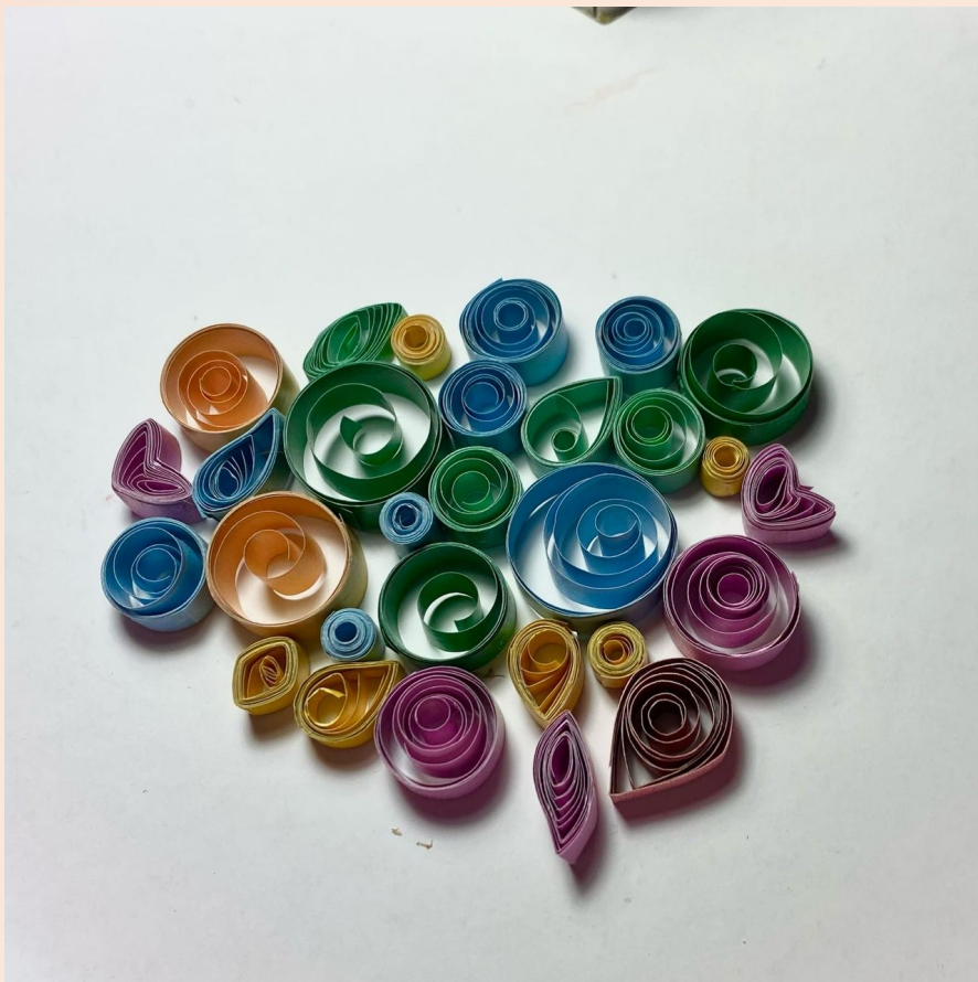
Создание бумажных элементов