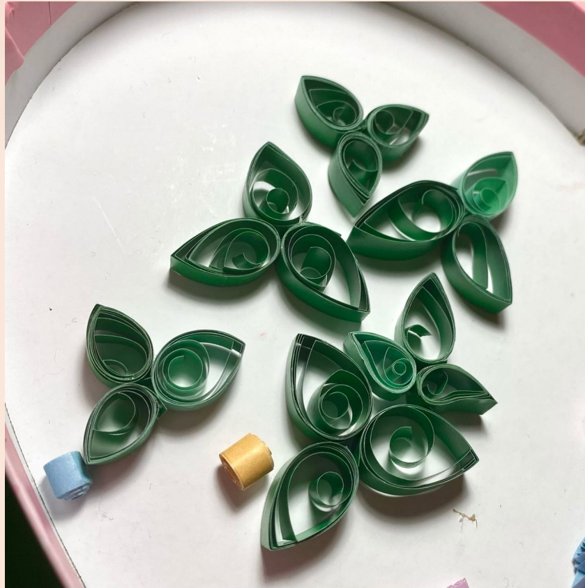
Создание сложных элементов