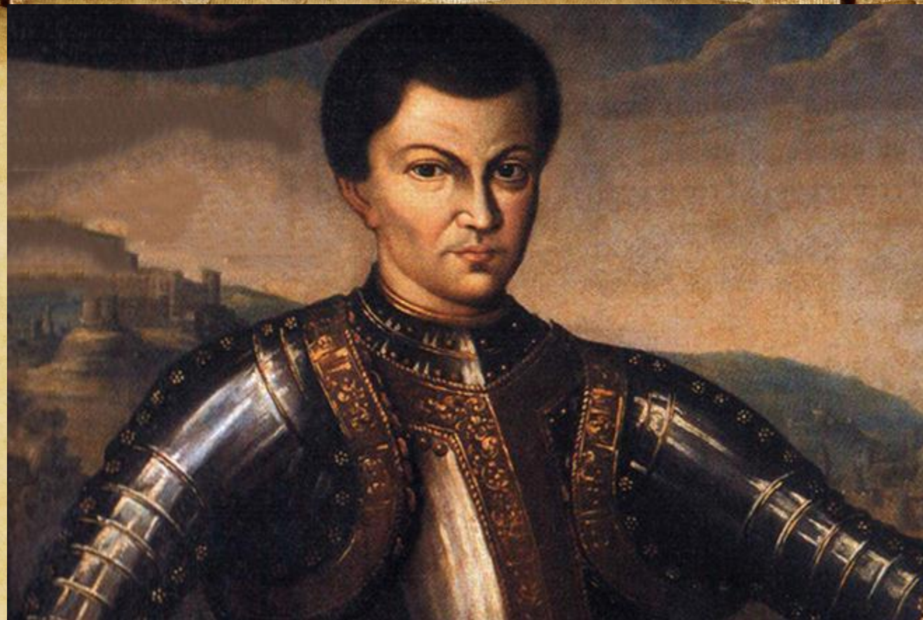
Лжедмитрий I (Григорий Отрепьев)