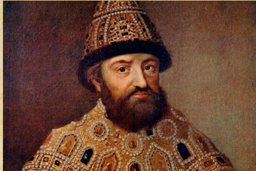
Царь Михаил Федорович Романов