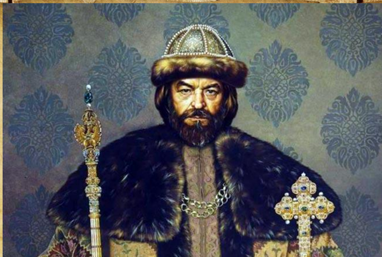
Первый выборный царь Борис Годунов