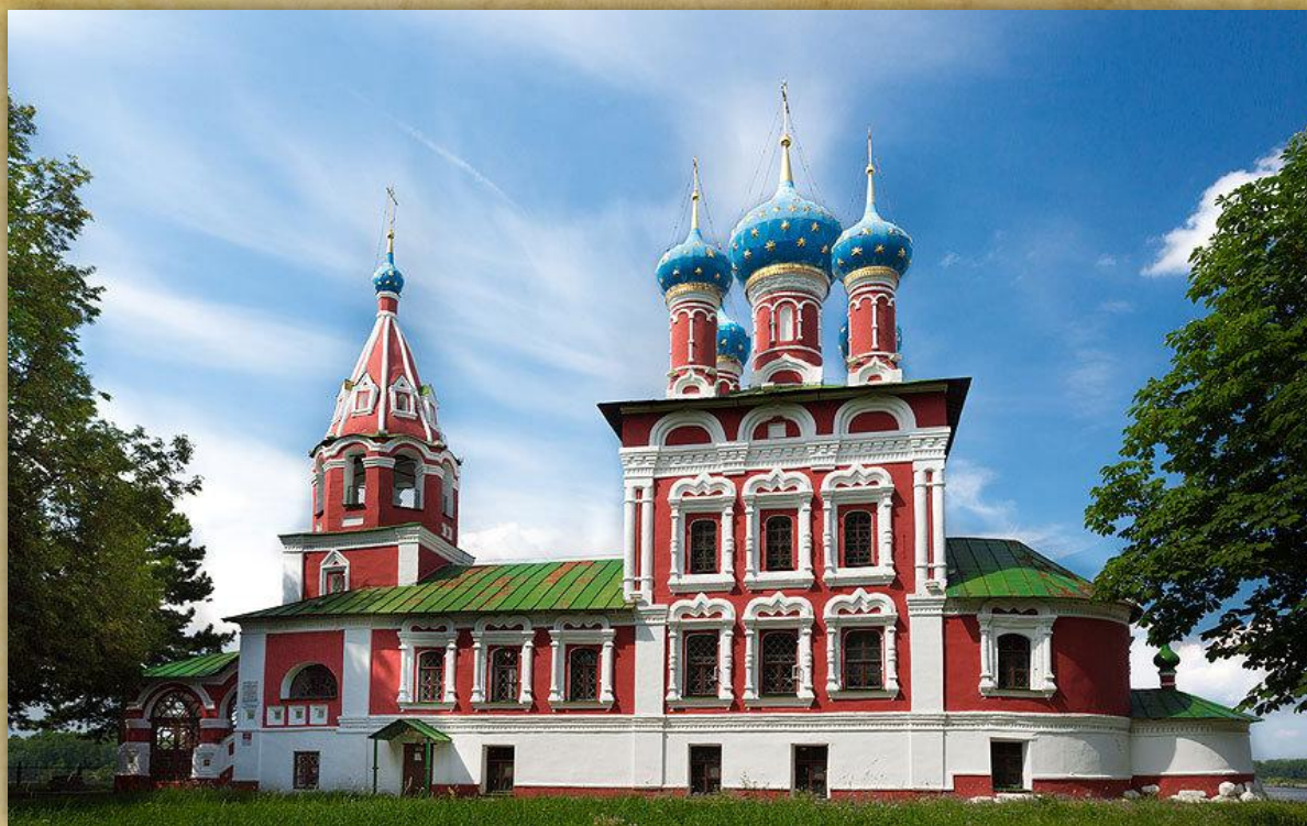
Храм в Угличе на месте гибели царевича Дмитрия