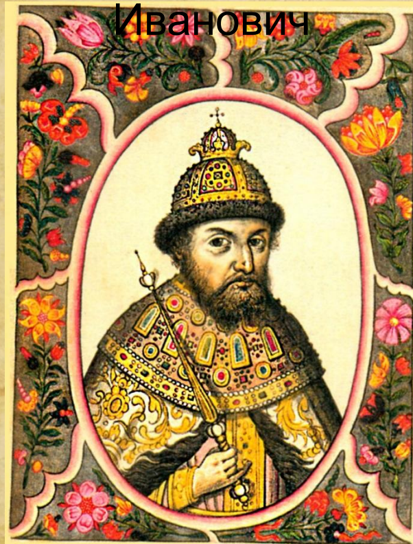
Царь Федор Иванович