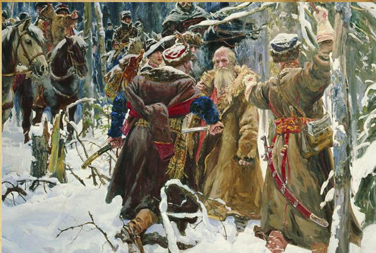
крестьянин Иван Сусанин