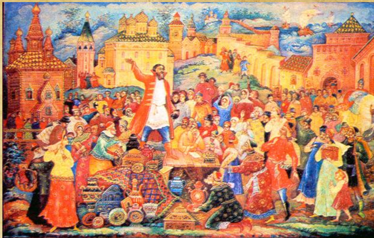
Воззвание Кузьмы Минина к нижегородцам