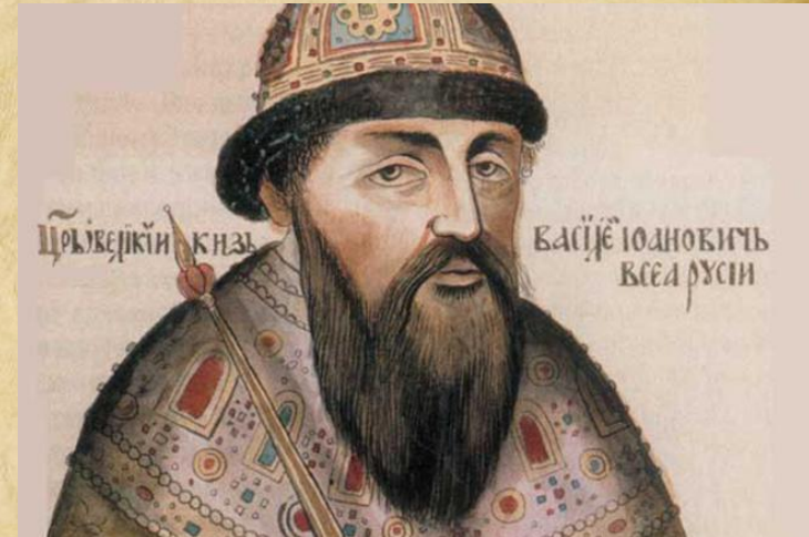
Боярин Василий Шуйский