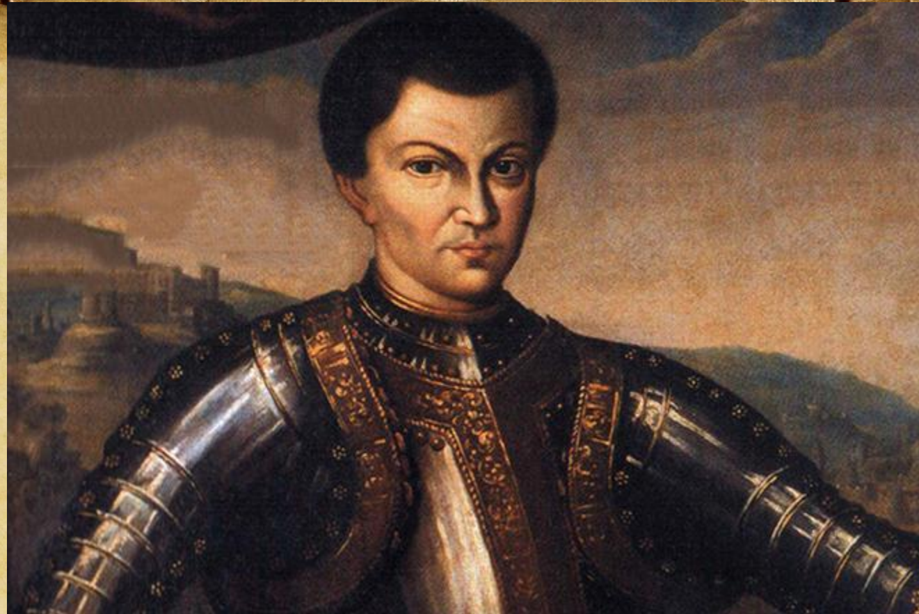
Лжедмитрий I (Григорий Отрепьев)