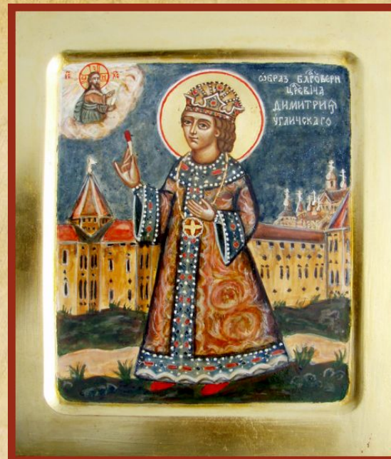
Царевы ч Дмитри й