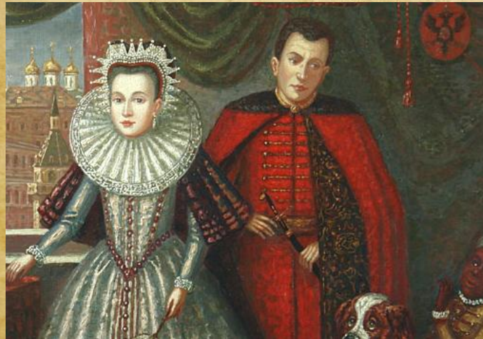
Лжедмитрий I и Марина Мнишек