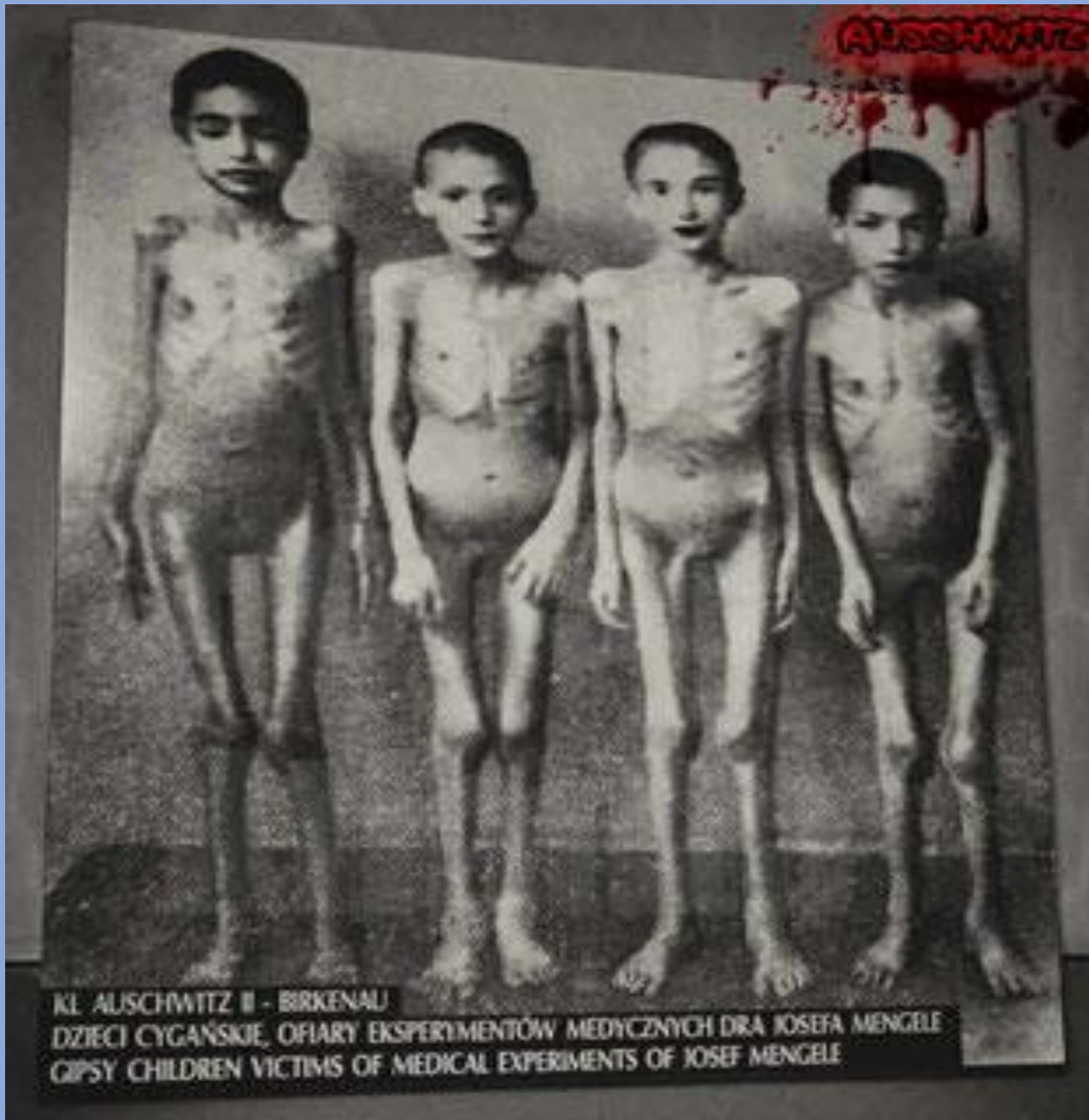
KL. AUSCHWITZ II - BIRKENAU DZIECI CYGAŃSKIE, OFIARY EKSPERYMENTÓW MEDYCZNYCH DRA JOSEFA MENGELE GIPSY CHILDREN VICTIMS OF MEDICAL EXPERIMENTS OF JOSEF MENGELE