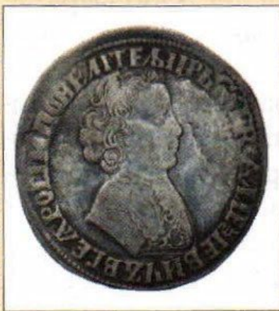
Серебряный рубль 1704 г.