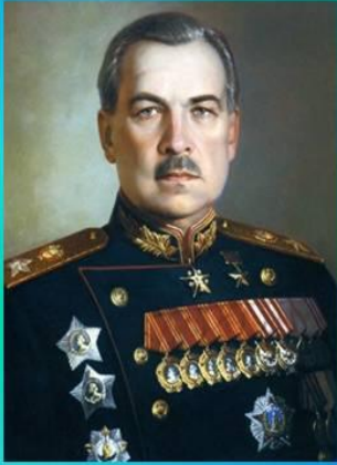
Леонид Александрович Говоров