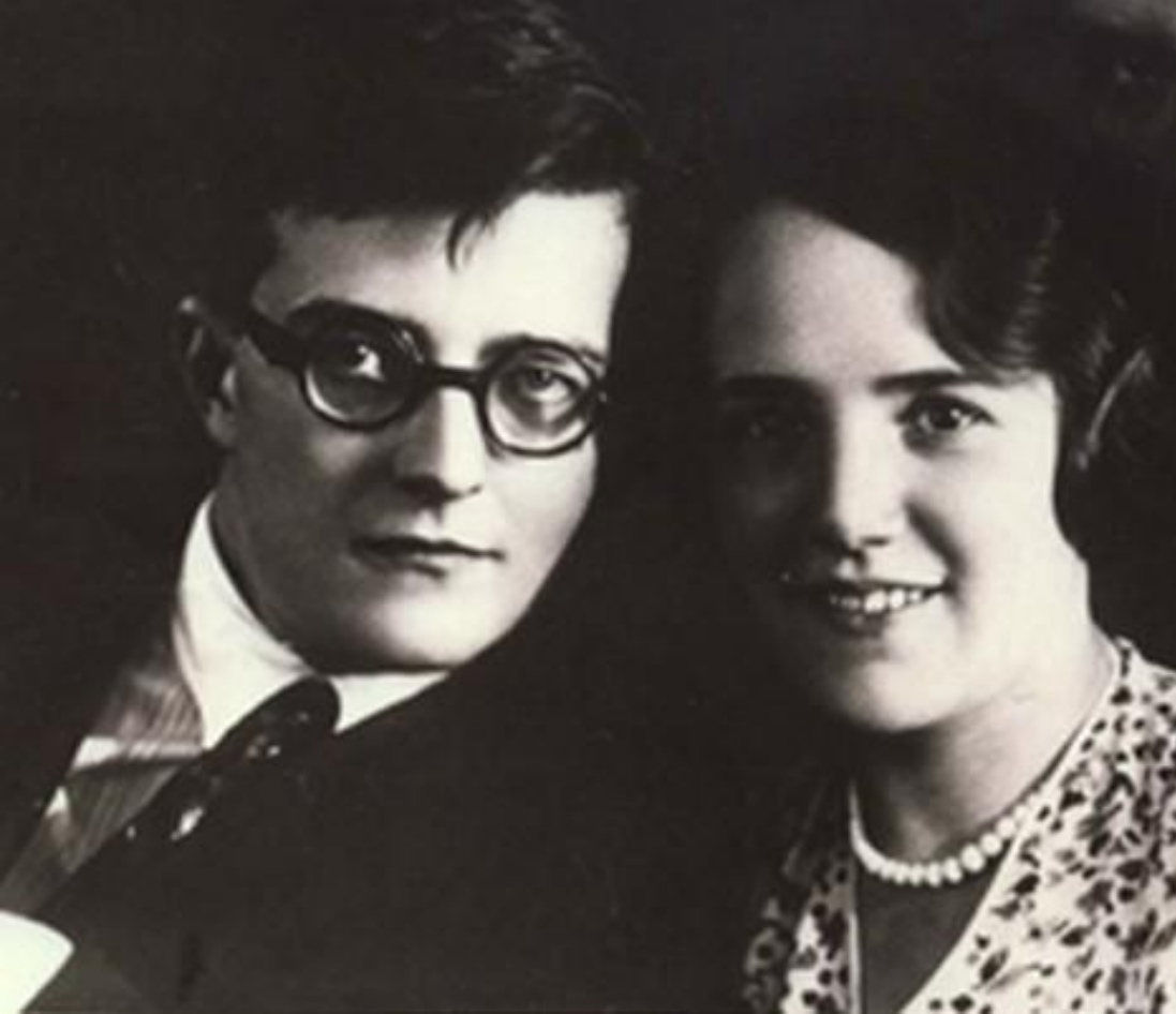
Шостакович с первой женой Ниной Варзар