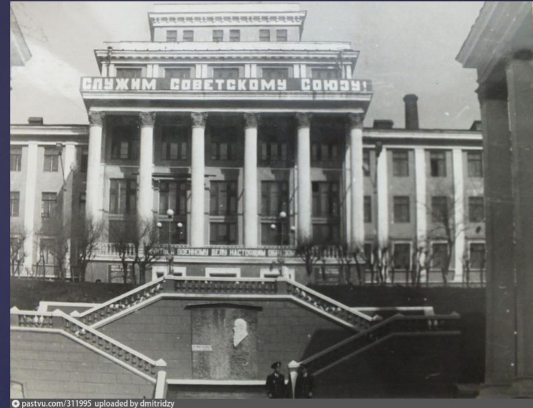
ТВВМУ г. Владивосток