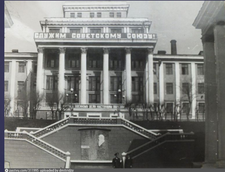
ТВВМУ г. Владивосток