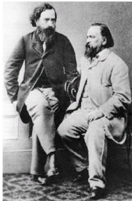
А.И.Герцен и Н.П.Огарев

Основой революционно-демократического движения с в 20-30-е годы XIX века становятся студенческие кружки: