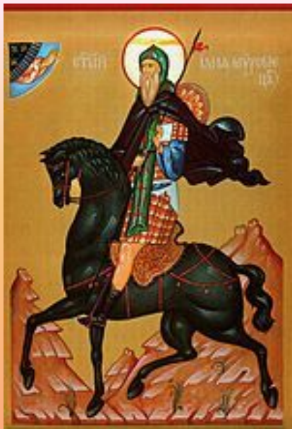
Илья Муромец (1063-1118)