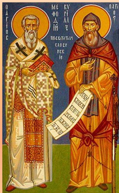
Кирилл (827-869) и Мефодий (815-885)