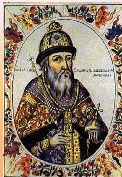
Владимир Мономах (1053-1125)