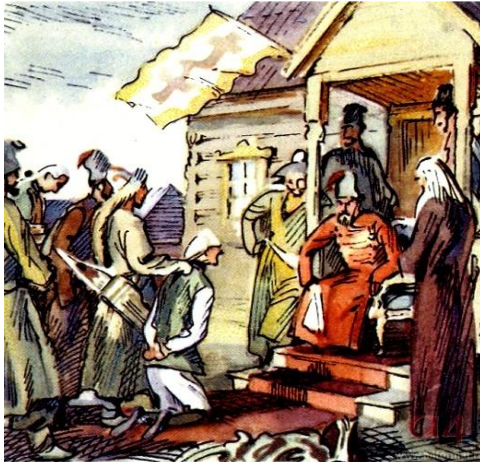
«Суд Пугачёва». Художник А.Иткин.

Каким перед читателями предстаёт Пугачёв во взятой им Белогорской крепости? Почему всё происходящее Гринёв называет комедией?