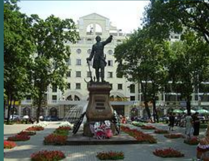
Воронеж, Петровский сквер. Памятник Петру I