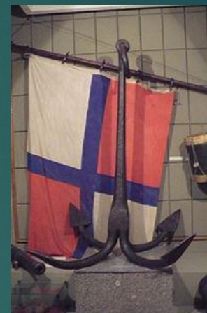
Якорь XVIII века в экспозиции эпохи Петра I Воронежского областного краеведческого музея