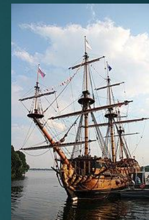
Корабль-музей «Гото Предестинация»