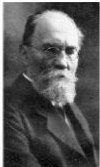
Карл Бругман (1849 - 1919) Karl Brugmann

Центральные фигуры немецкого младограмматизма: