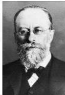
Бертольд Дельбрюк (1842 - 1922) Bertold Delbrück