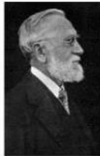
Август Лескин (1840 - 1916) August Leskien