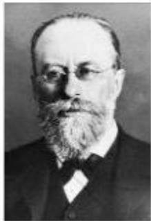
Бертольд Дельбрюк (1842 - 1922) Bertold Delbrück