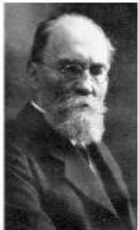
Карл Бругман (1849 - 1919) Karl Brugmann

Центральные фигуры немецкого младограмматизма: