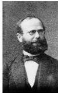
Герман Пауль (1846 - 1921) Hermann Paul