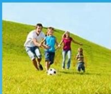
Поддержка семьи и малообеспеченных