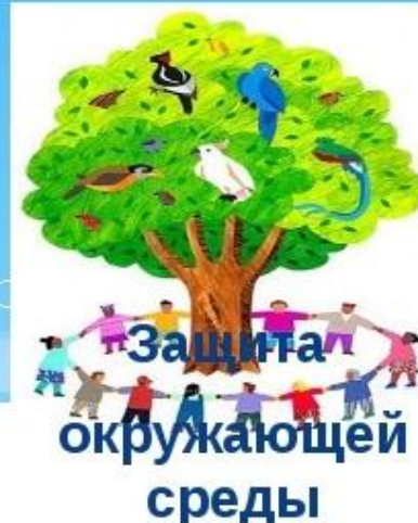
Защита окружающей среды