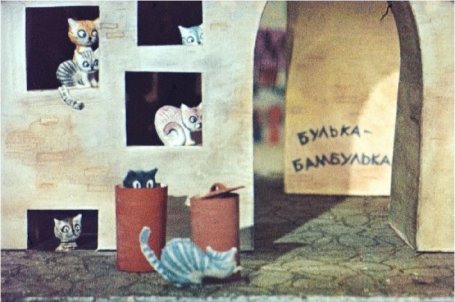
Булька его звали. Гроза всех окрестных кошек.