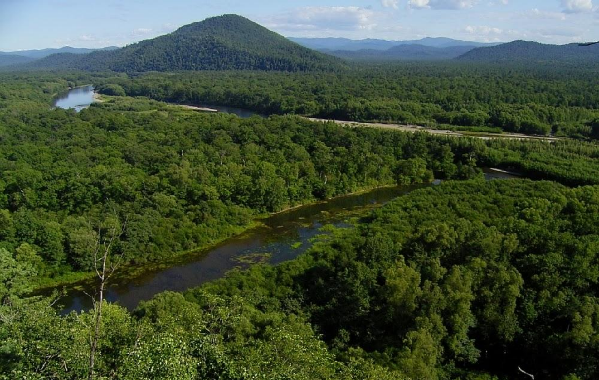
Приморский край. Уссурийская тайга.