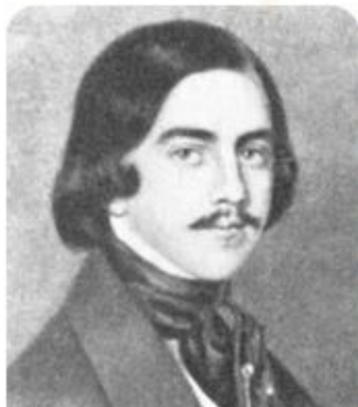
Михаил Александрович Бакунин (1814—1876)