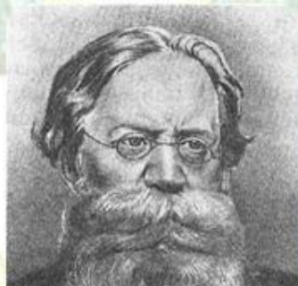
Петр Лаврович Лавров (1823—1900)