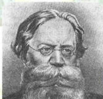
Петр Лаврович Лавров (1823—1900)