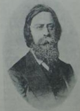
П. Л. Лавров. (70-е годы).

Память великихъ людей всегда объединяет. С чувствомъ особого удовлетворения редакция констатируетъ тотъ фактъ, что чествование 20-тилѣтня со дня смерти Петра Лавровича Лаврова объединило в одномъ сборникѣ представителей самыхъ различныхъ мировоззреній и общественныхъ теченій. К сожалѣнью, «позлащившие обстоятельства» не даютъ возможности отметить эту дату такъ, какъ она того заслуживаетъ и какъ бы хотелось всемъ участникамъ настоящаго изданія. И редакция и сотрудники сборника «Впередъ» сознаютъ, что венокъ,