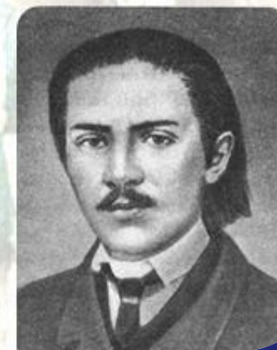
Петр Никитич Ткачев (1844—1885)