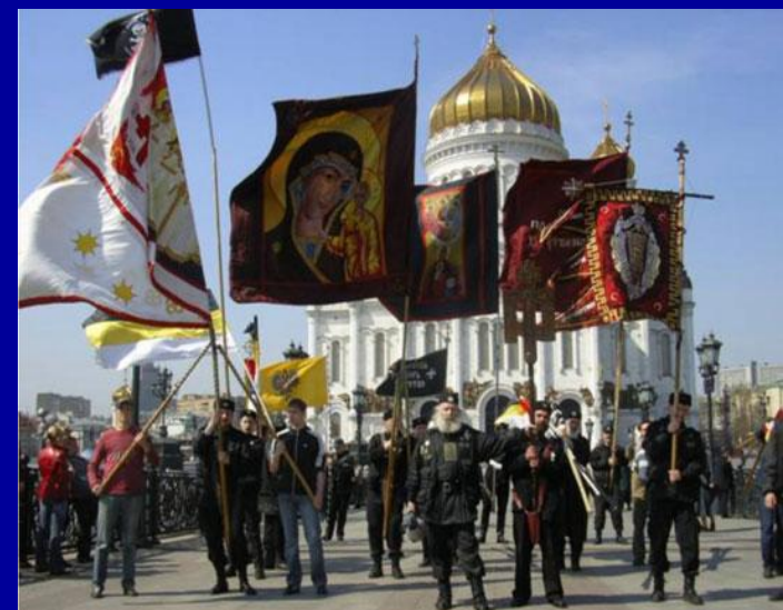
Русское национальное единство