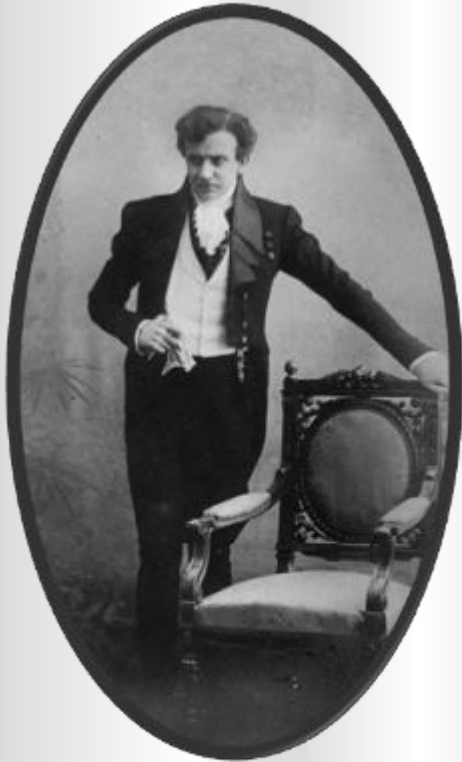
Чацкий – Качалов. постановка МХАТ