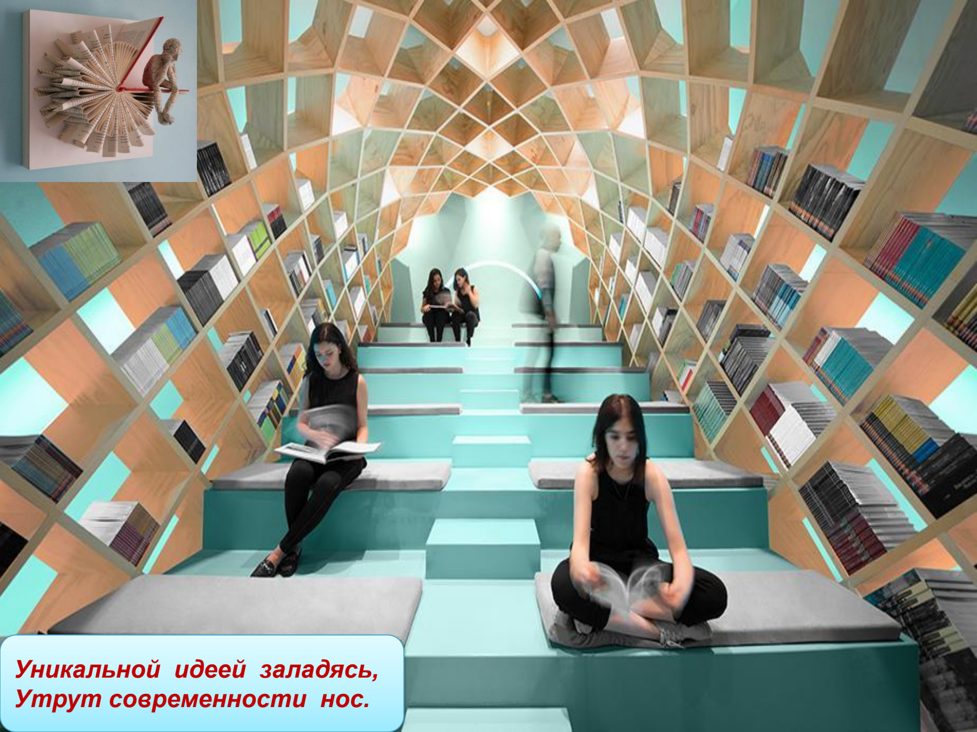
Уникальной идеей залядась, Утрут современности нос.