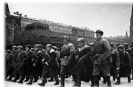
Парад на Красной Площади, 1941 год

149-ой танковой бригады 30-го автополка 36-го отдельного автотранспортного батальона. Был ранен. После выздоровления воевал на Первом Украинском фронте под командованием Рокоссовского. Дошёл до Берлина и распалился на одной из колон Рейхстага. Вернулся домой, работал водителем в ДОЗа с. Овсянка. Умер 14 сентября 1990 г.