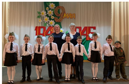
Клуб-филиал пос. Усть-Мана