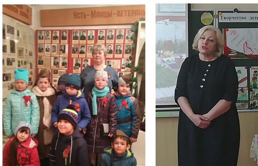
Народный краеведческий музей пос. Усть-Мана