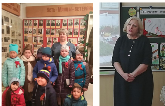
Народный краеведческий музей пос. Усть-Мана