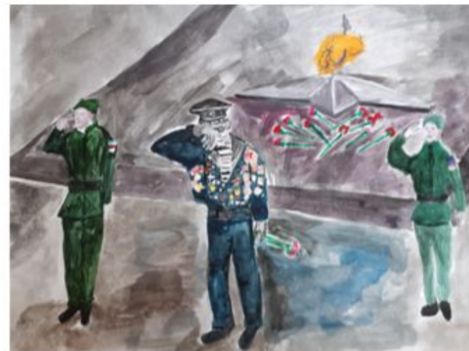
Рисунок Горячкиной Иветты / обучающейся 3 Б класса