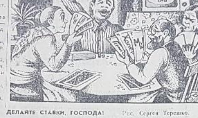
ДЕЛАЙТЕ СТАВКИ, ГОСПОДА! Рис. Сергея Терешко.

...иногда... уже который день дождит. Законом вербы жидкая кустик под ветром северным дорож. И плеще пренежного омы токут дунцовою дистой. Поля безмятежно лустынью, и нет вопиут души жной. Здесь все торжественно- печально, на всем спокойствие налет, и журавлиный крик прощальный