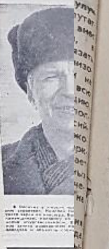
на проезде — Москва