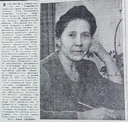
Каждый имеет право на защиту от безработицы

На вопросы безработных отвечает служба государственной службы занятости в Курганской области. — Какое отличие в выплате пособия по безработице в разных регионах? В каком регионе выплаты выше? — В зависимости от региона выплаты по безработице различаются. В среднем по России выплаты составляют 40% от среднего заработка за последние 12 месяцев до увольнения.