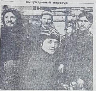
В. И. Шенников, первый заместитель председателя областного комитета КПСЗ.

СТУДЕНТЫ И ЖИЗНЬ Студенты Курганского государственного университета активно участвуют в общественной жизни и выполнении государственных заданий.