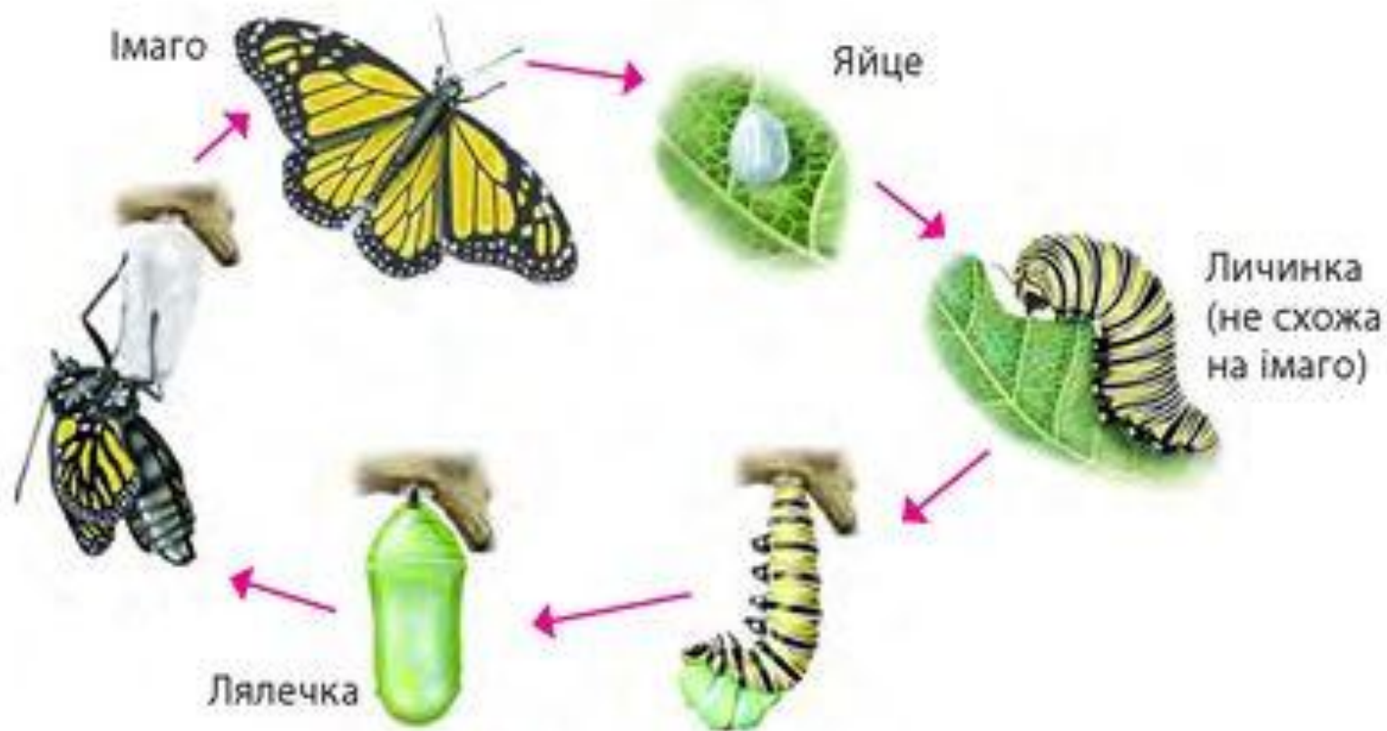
Схема розвитку з повним перетворенням на прикладі метелика