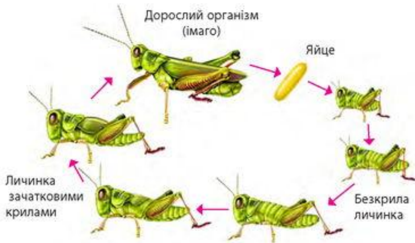
Схема розвитку з неповним перетворенням на прикладі коника