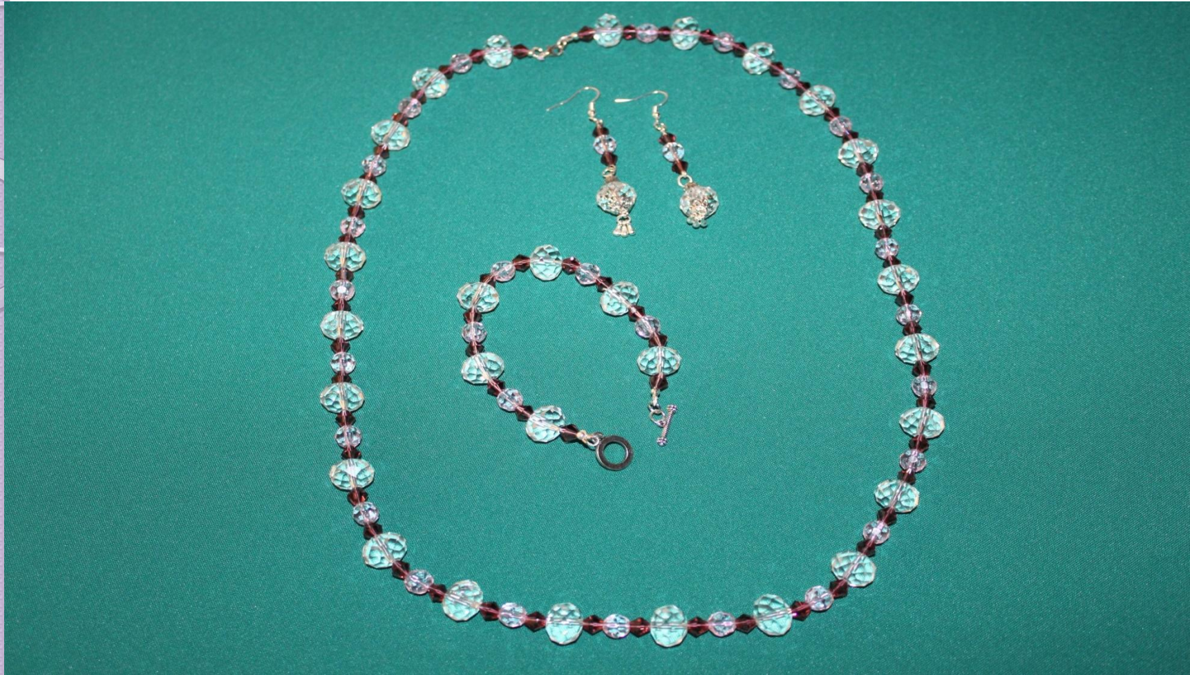
17. Бусы, браслет, серьги