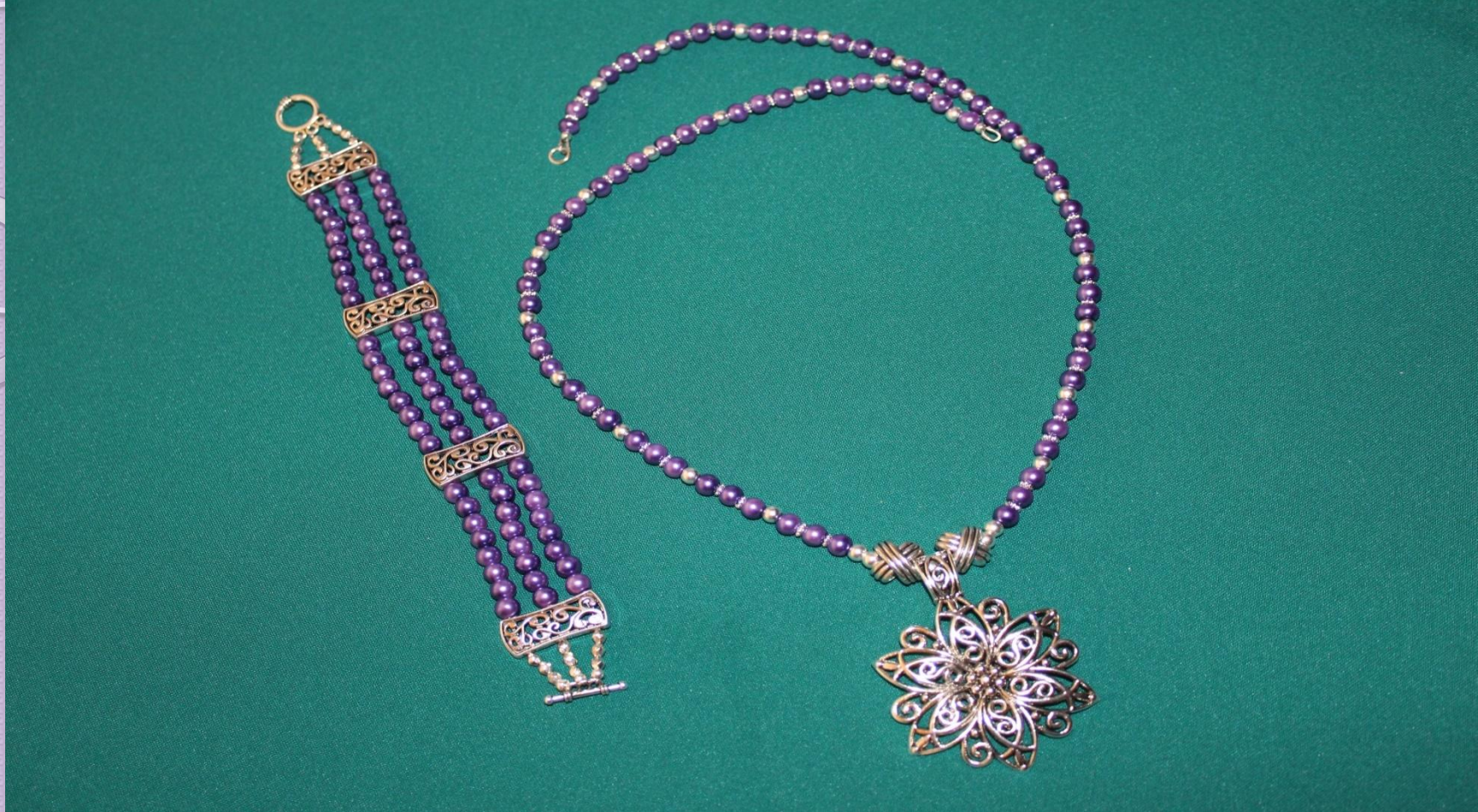
28. Бусы с подвеской, браслет