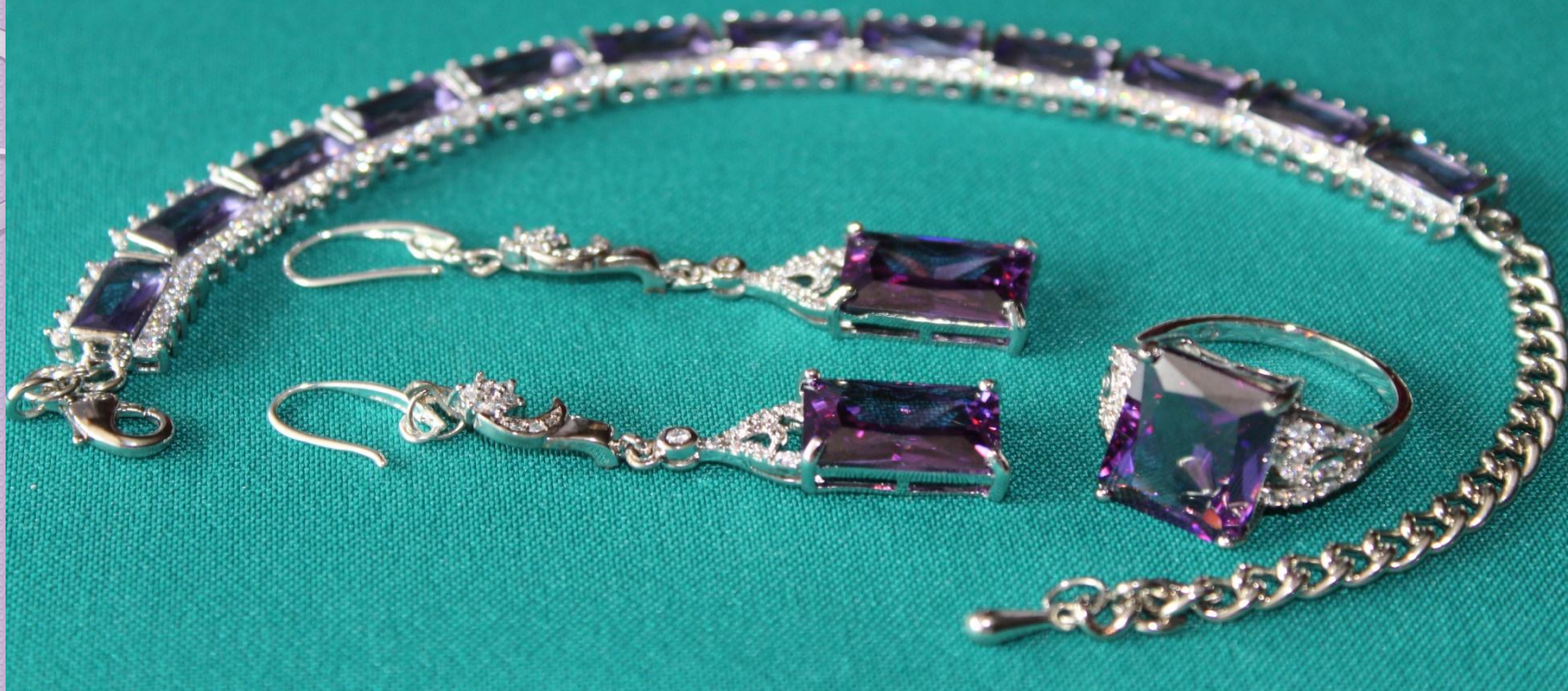
41. Браслет, кольцо, серьги