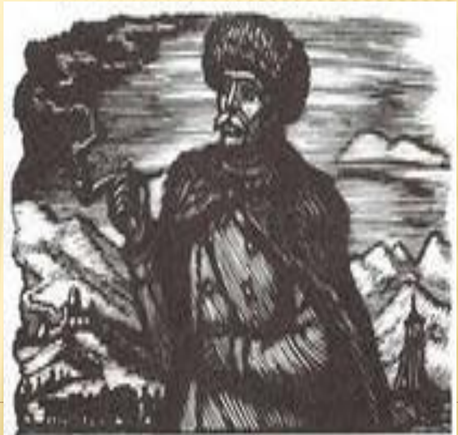
Максим Максимыч Илл. Ф. Д. Бондаренко 1961