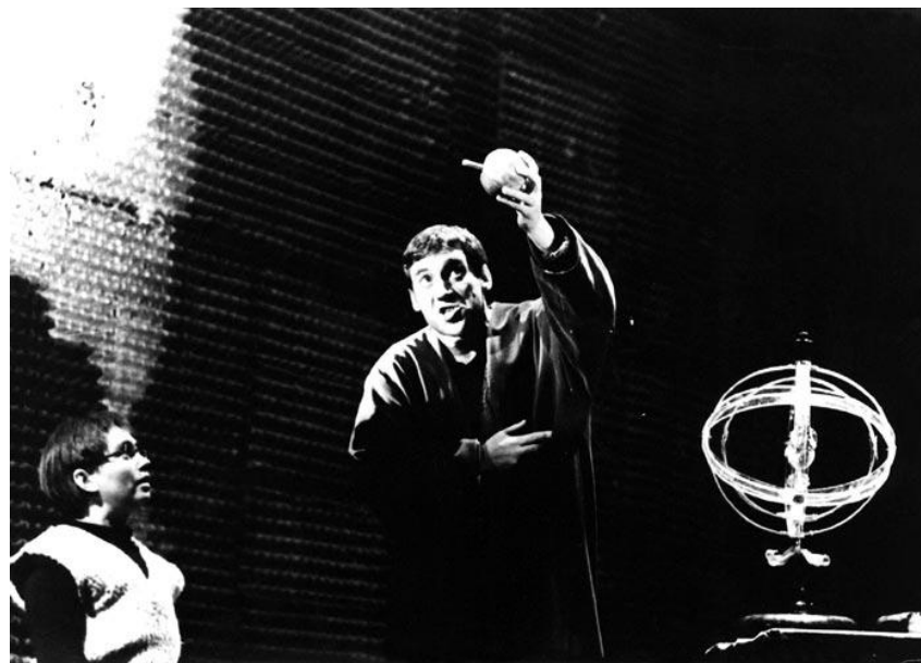
ЖИЗНЬ ГАЛИЛЕЯ. Б. Брехт. 1966 . Галилей.