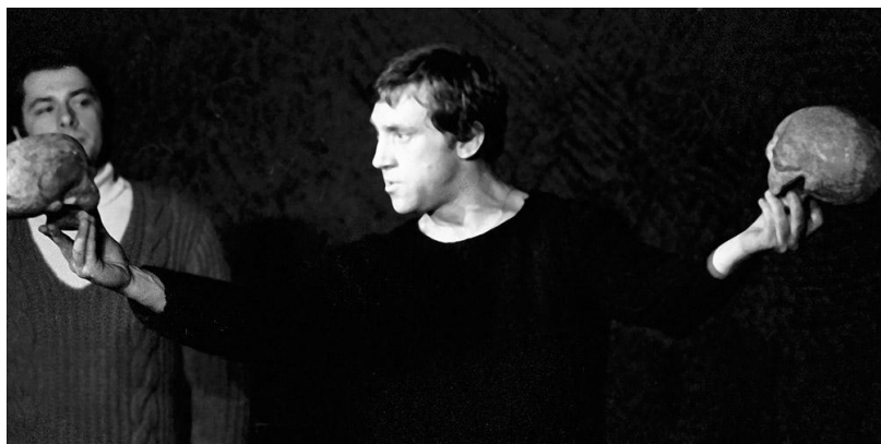
ГАМЛЕТ. В. Шекспир. 1971. Гамлет.