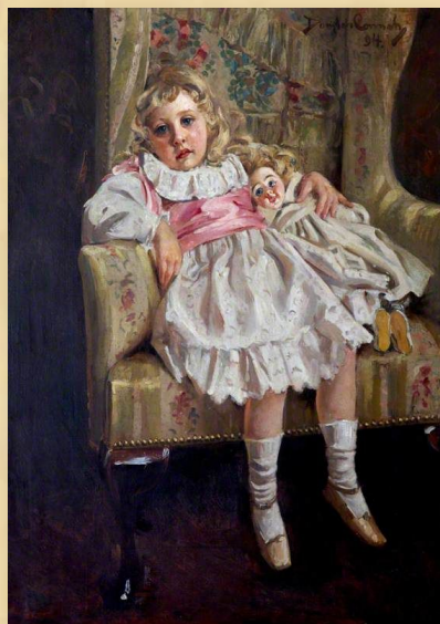
Агата Мэри Кларисса Миллер