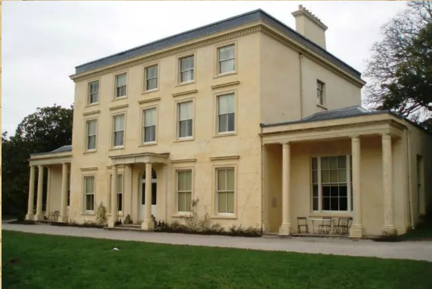
Дом Агаты Кристи