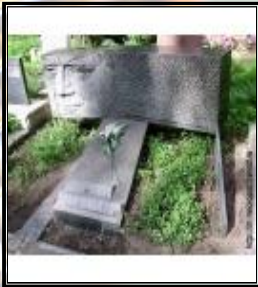
Могила Юрия Визбора на Новокунцевском кладбище

1999 г. – двухтомник стихов, песен и прозы, компакт-диски.