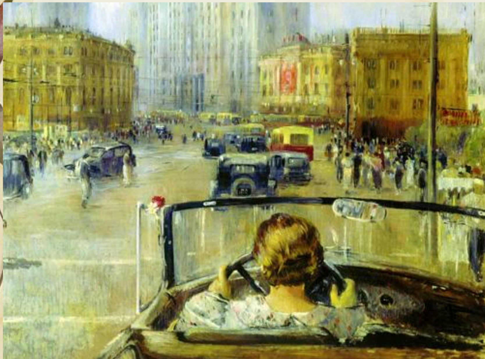
Юрий Пименов. Новая Москва. 1937 г.