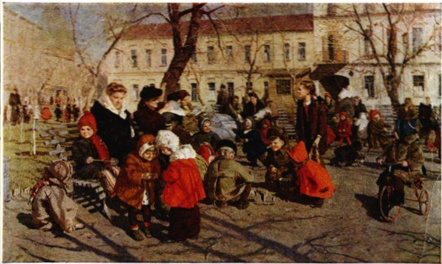
Яблонская Татьяна Ниловна. Весна. 1950 г.