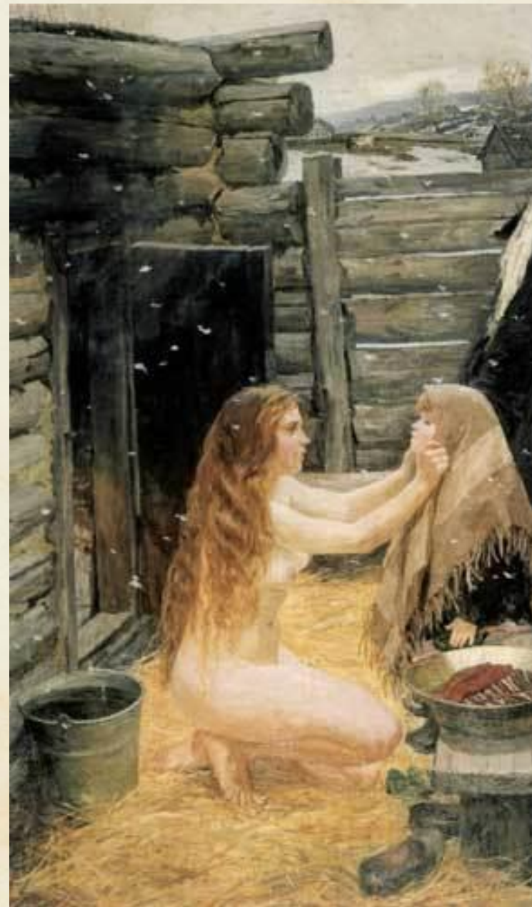
А. Пластов. Весна. В бане. 1954 г.