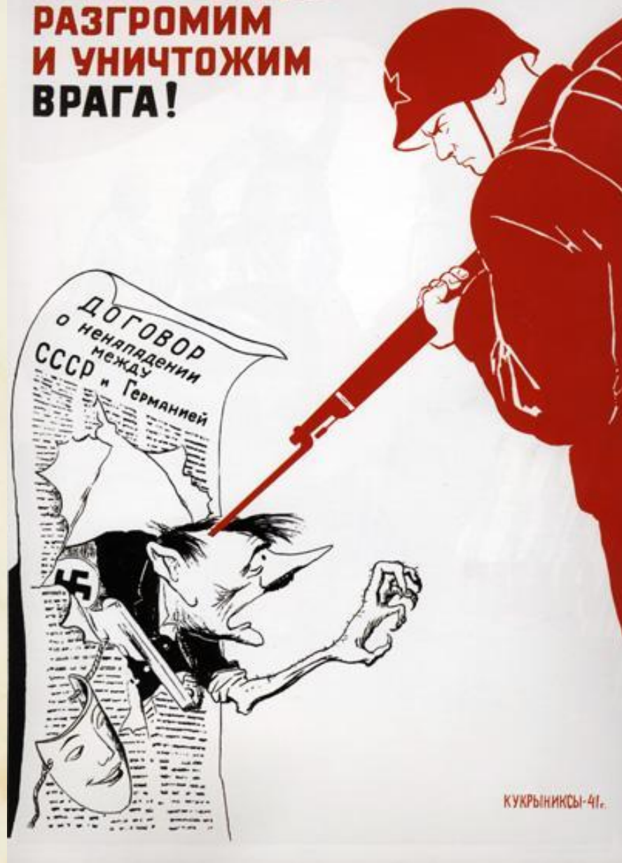
«Беспощадно разгромим и уничтожим врага!» Кукрыниксы, 1941