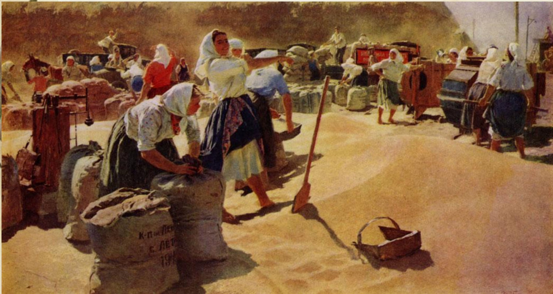
Т. Яблонская. Хлеб. 1949 г.