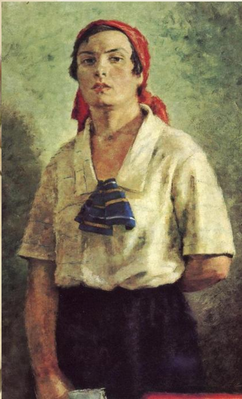
Г.Г. Рязский. Делегатка. 1927 г.