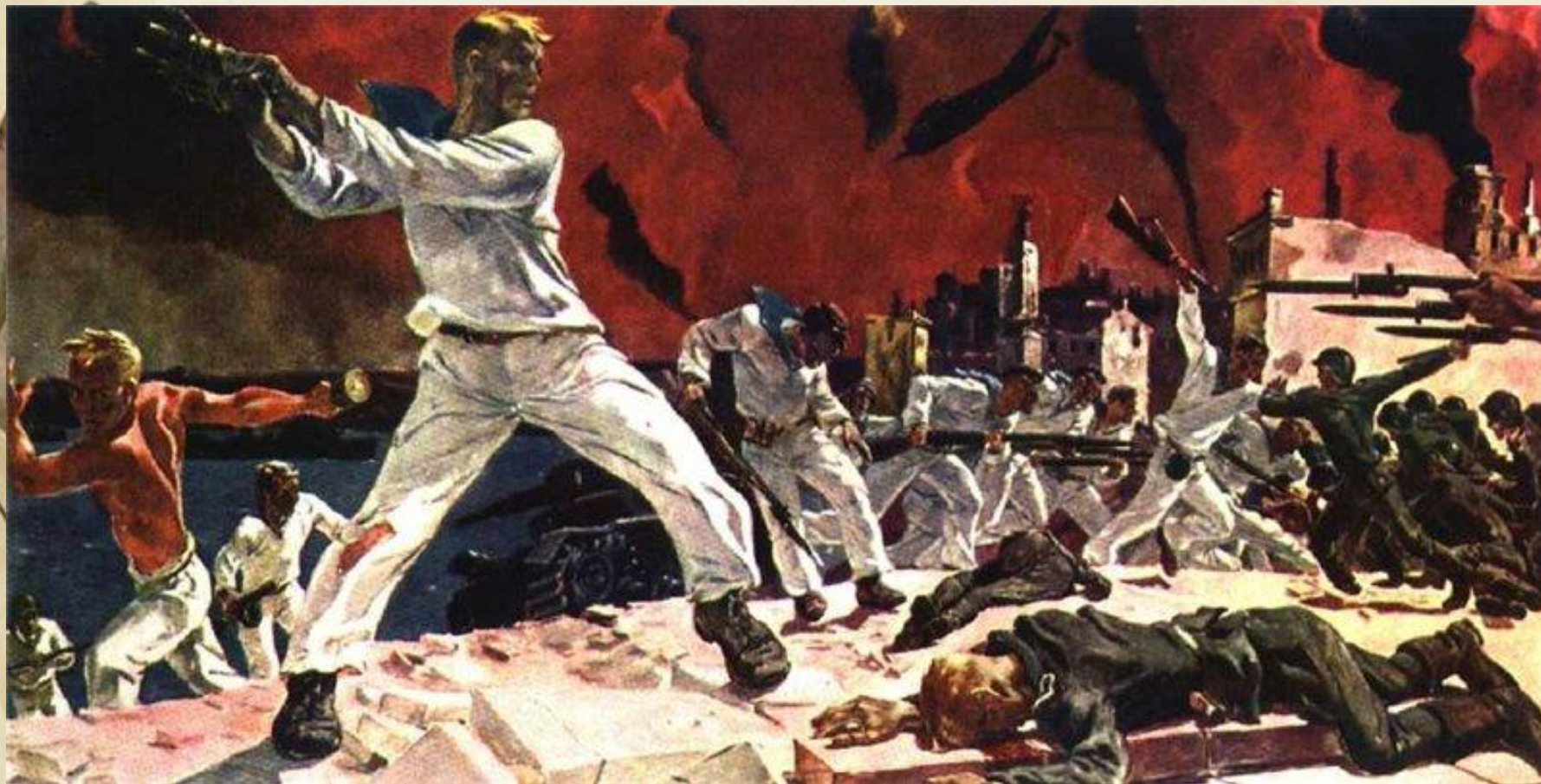
А. Дейнека. Оборона Севастополя. 1942 г.