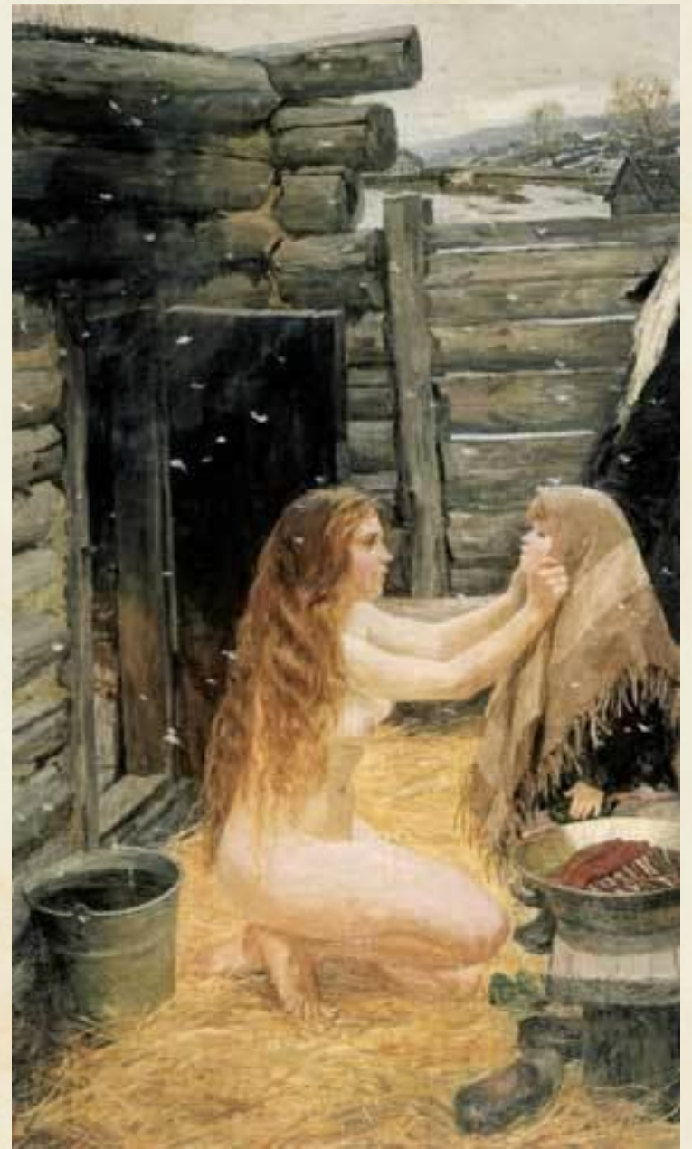
А. Пластов. Весна. В бане. 1954 г.