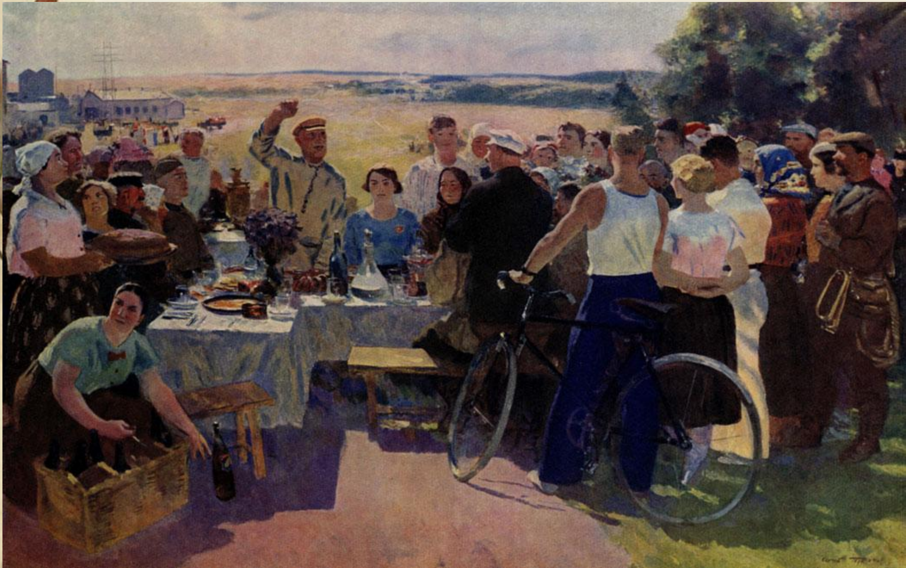
С. В. Герасимов. Колхозный праздник. 1937 г.