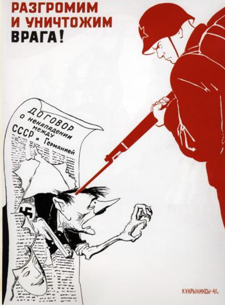
«Беспощадно разгромим и уничтожим врага!» Кукрыниксы, 1941