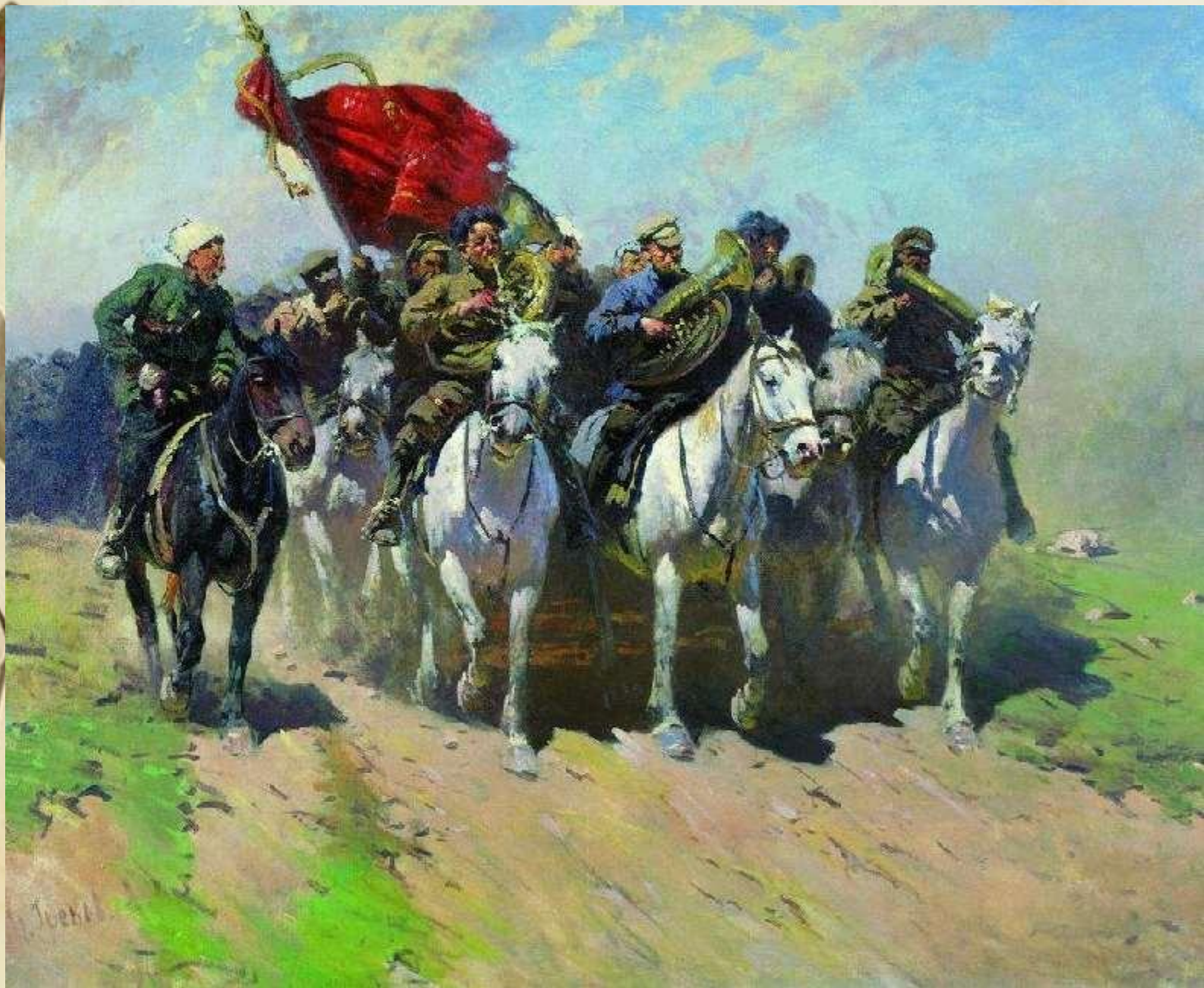
М. Греков. Трубачи Первой Конной. 1934 г.