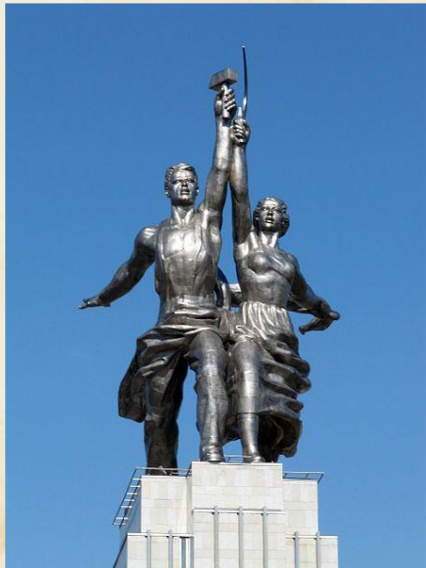
В. Мухина. Рабочий и колхозница