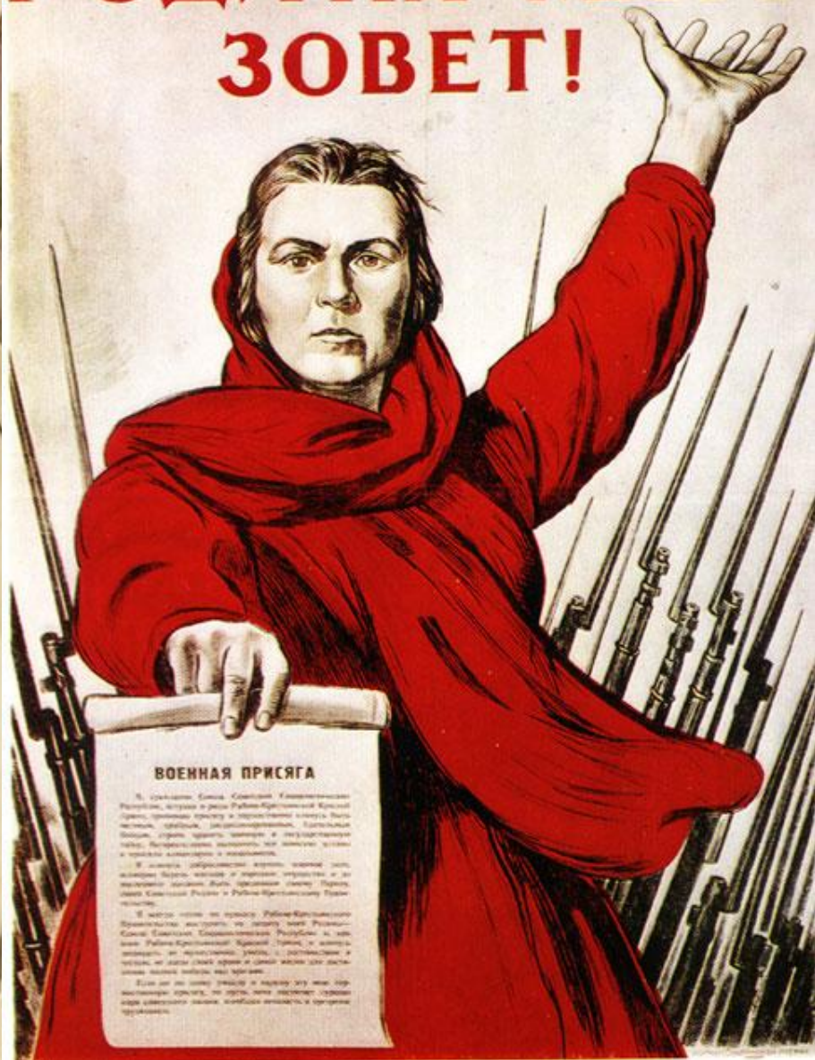
И. Тоидзе. Плакат «Родина-мать зовет!»