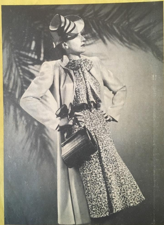
ENSEMBLE DE LUCEBER