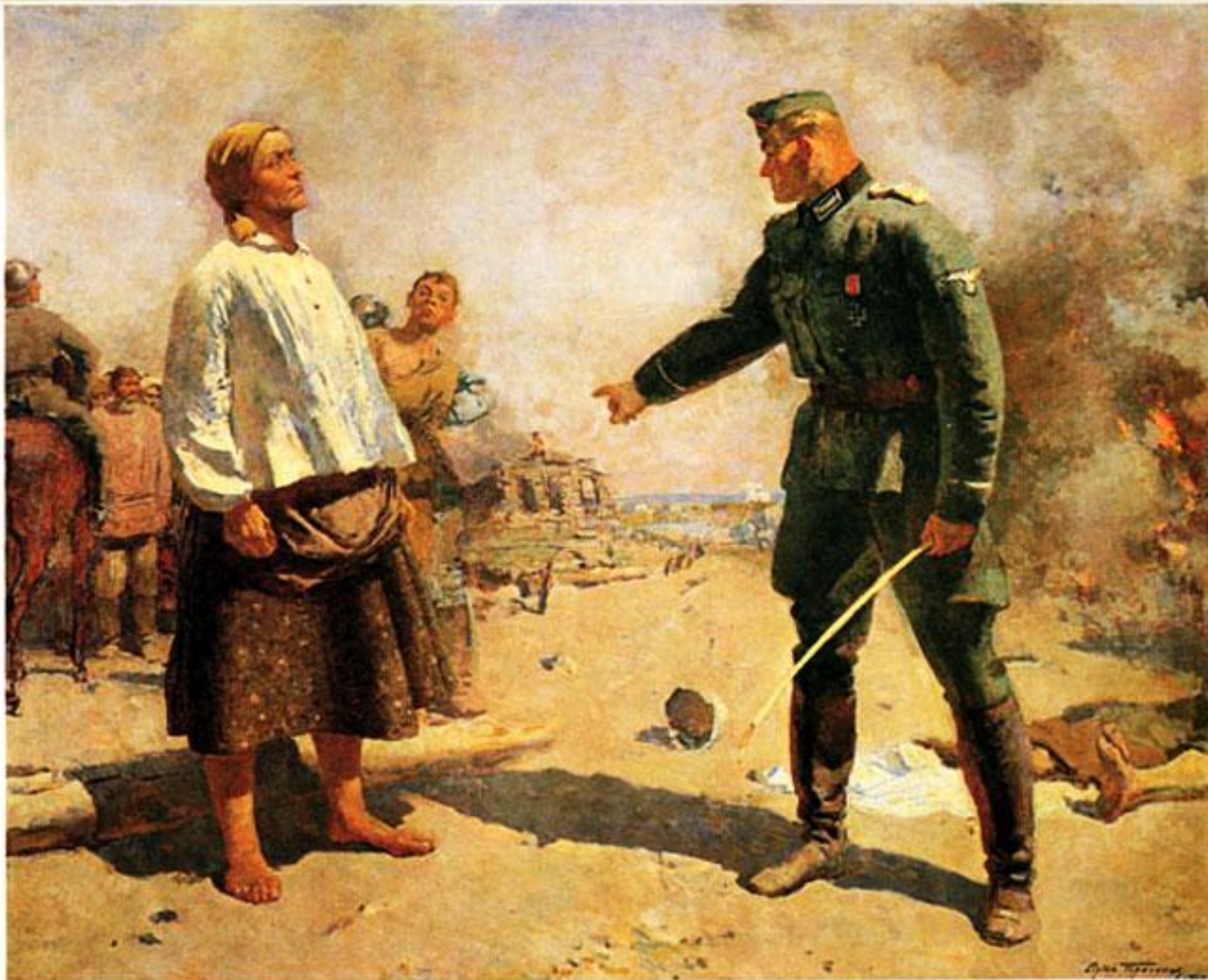
С. Герасимов. Мать партизана. 1943 г.