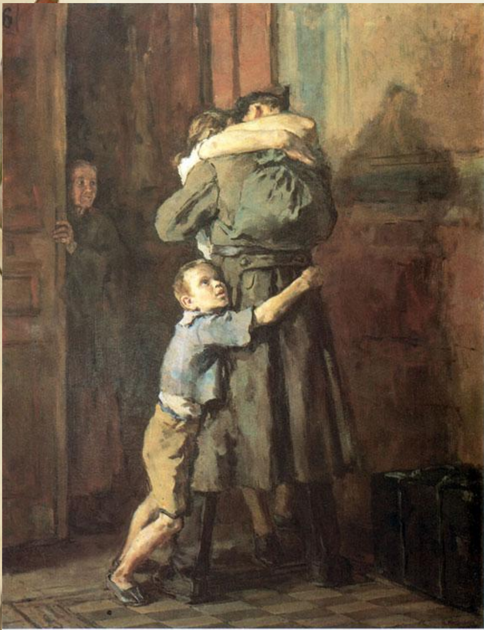
В. Костецкий. Возвращение. 1947 г.