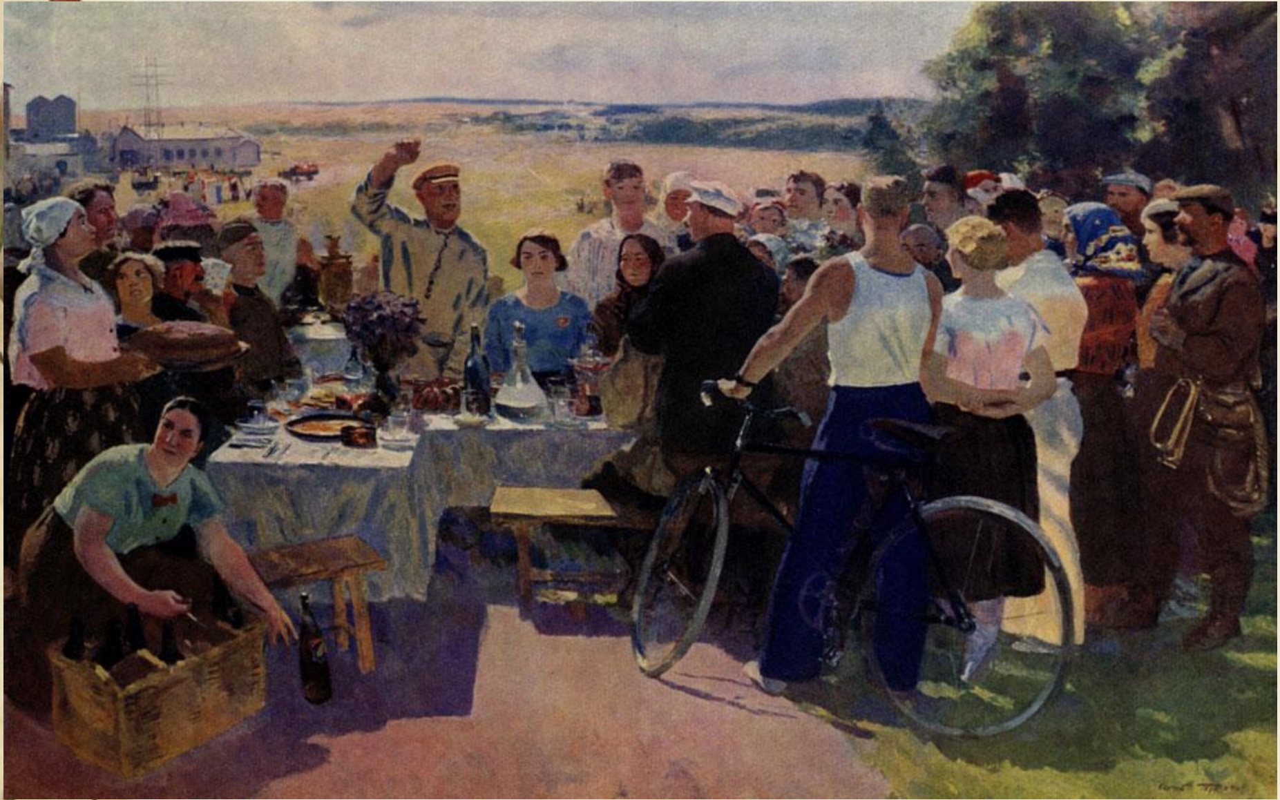
С. В. Герасимов. Колхозный праздник. 1937 г.