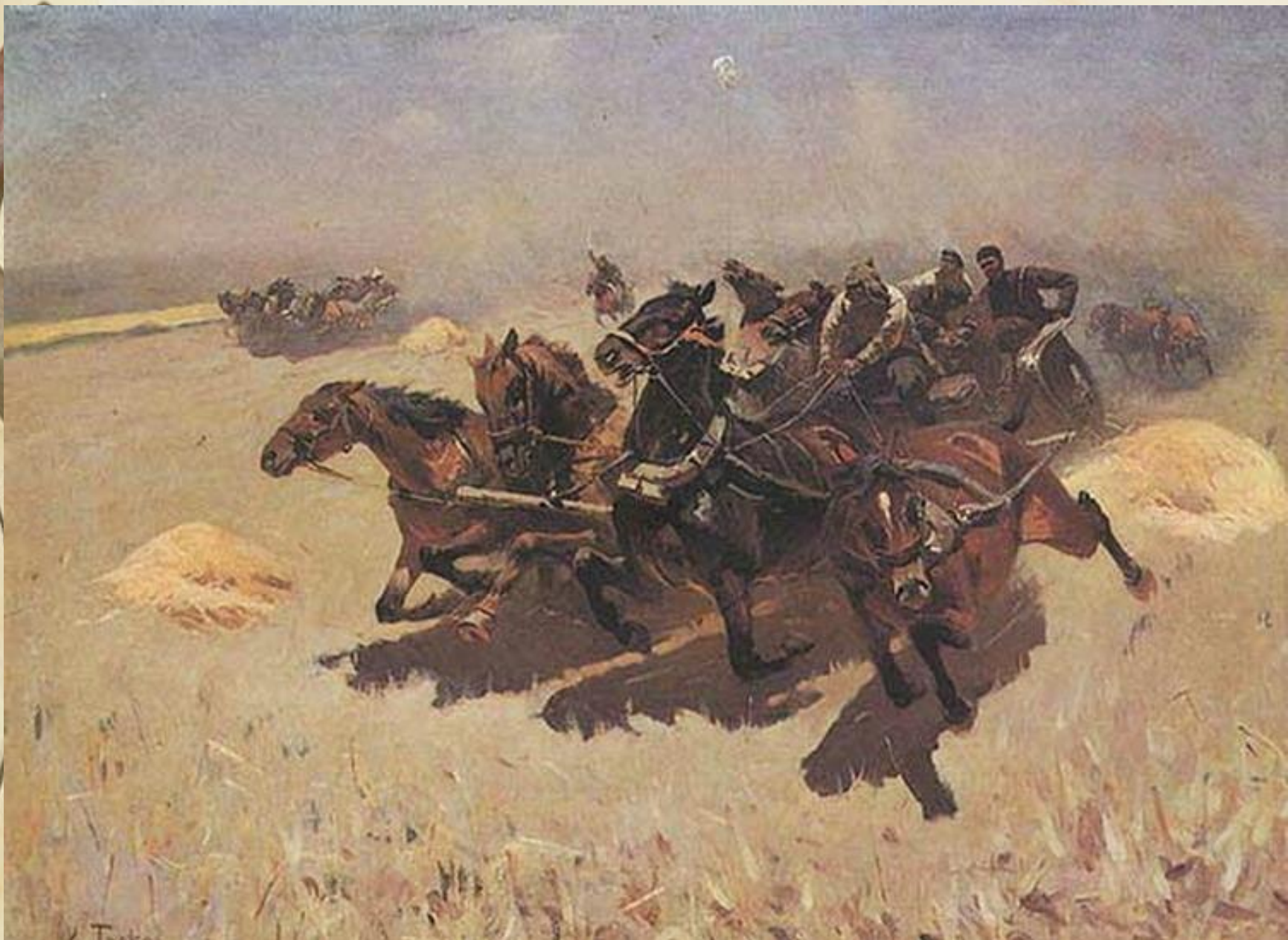
М. Греков. Тачанка. 1925 г.