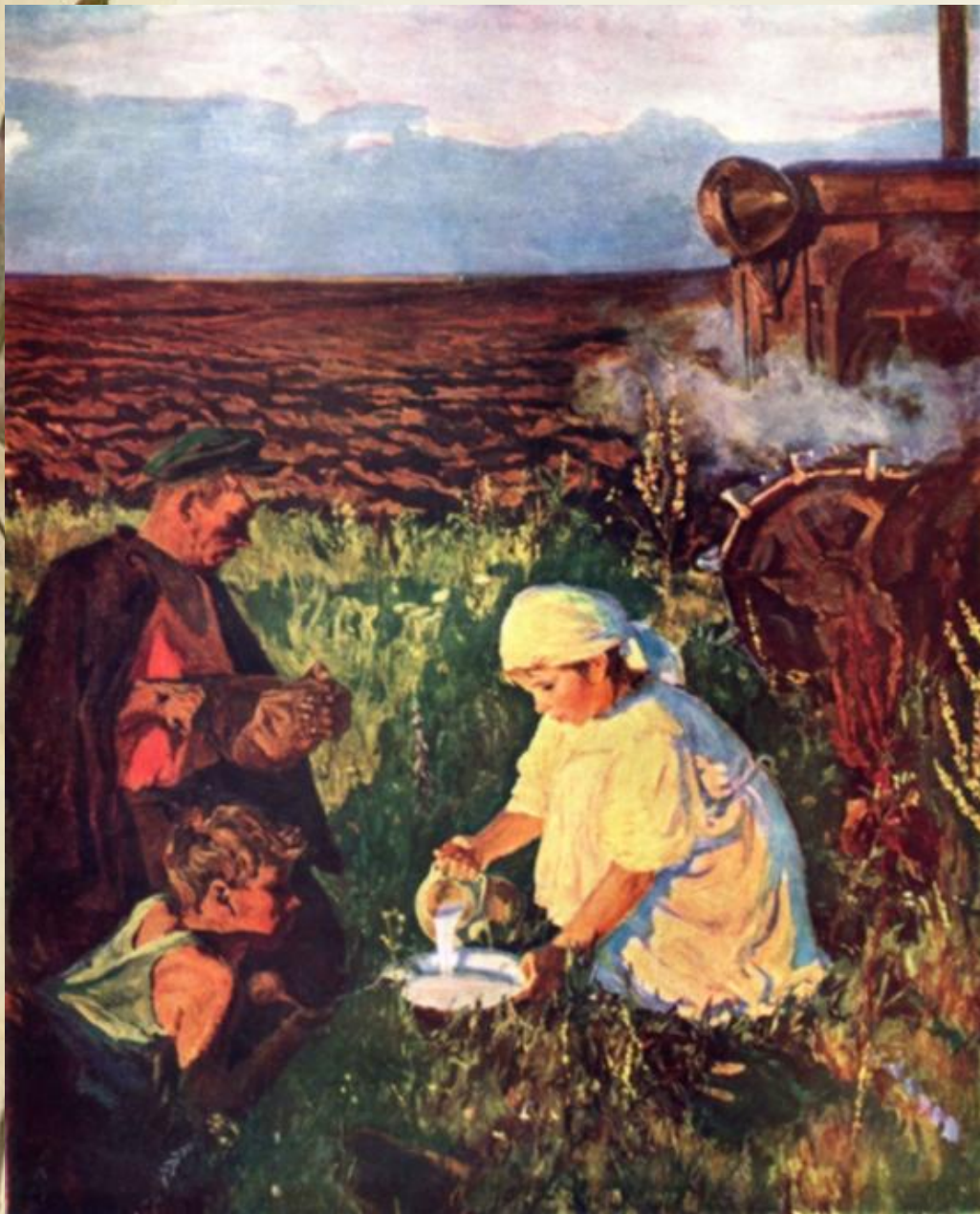
А. Пластов. Ужин трактористов 1951 г.