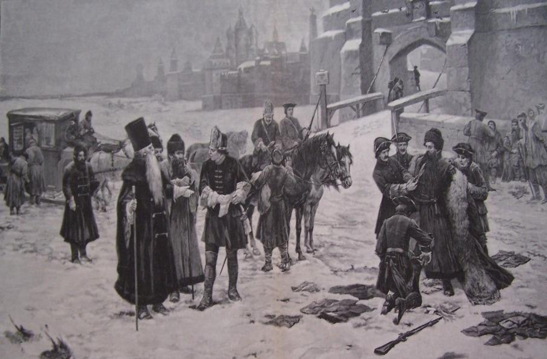
Насильственное введение западной одежды и бритья при Петре I