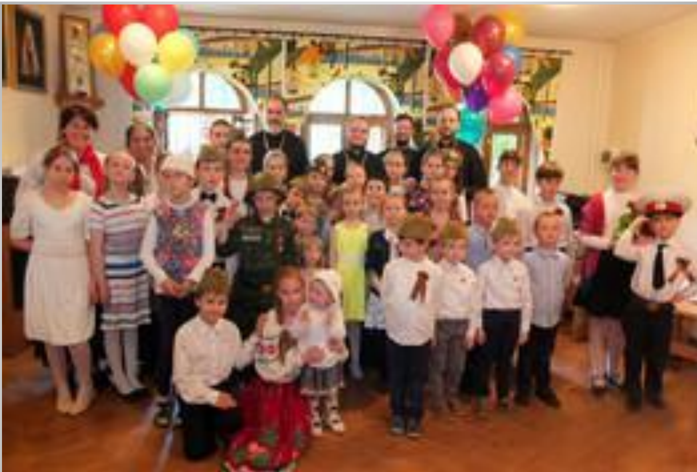
Приходская школа. Праздник.