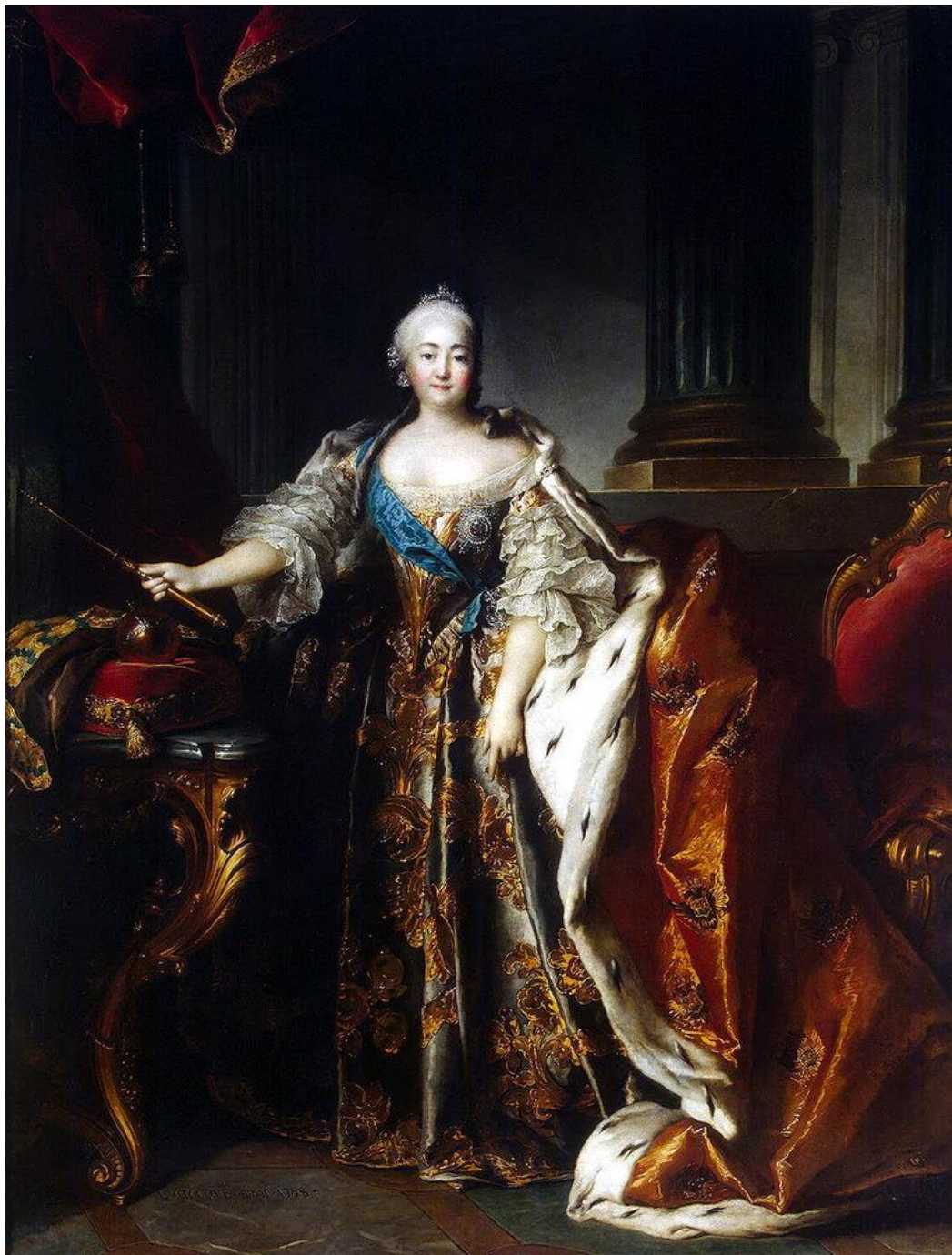
Луи Токке, портрет императрицы Елизаветы Петровны