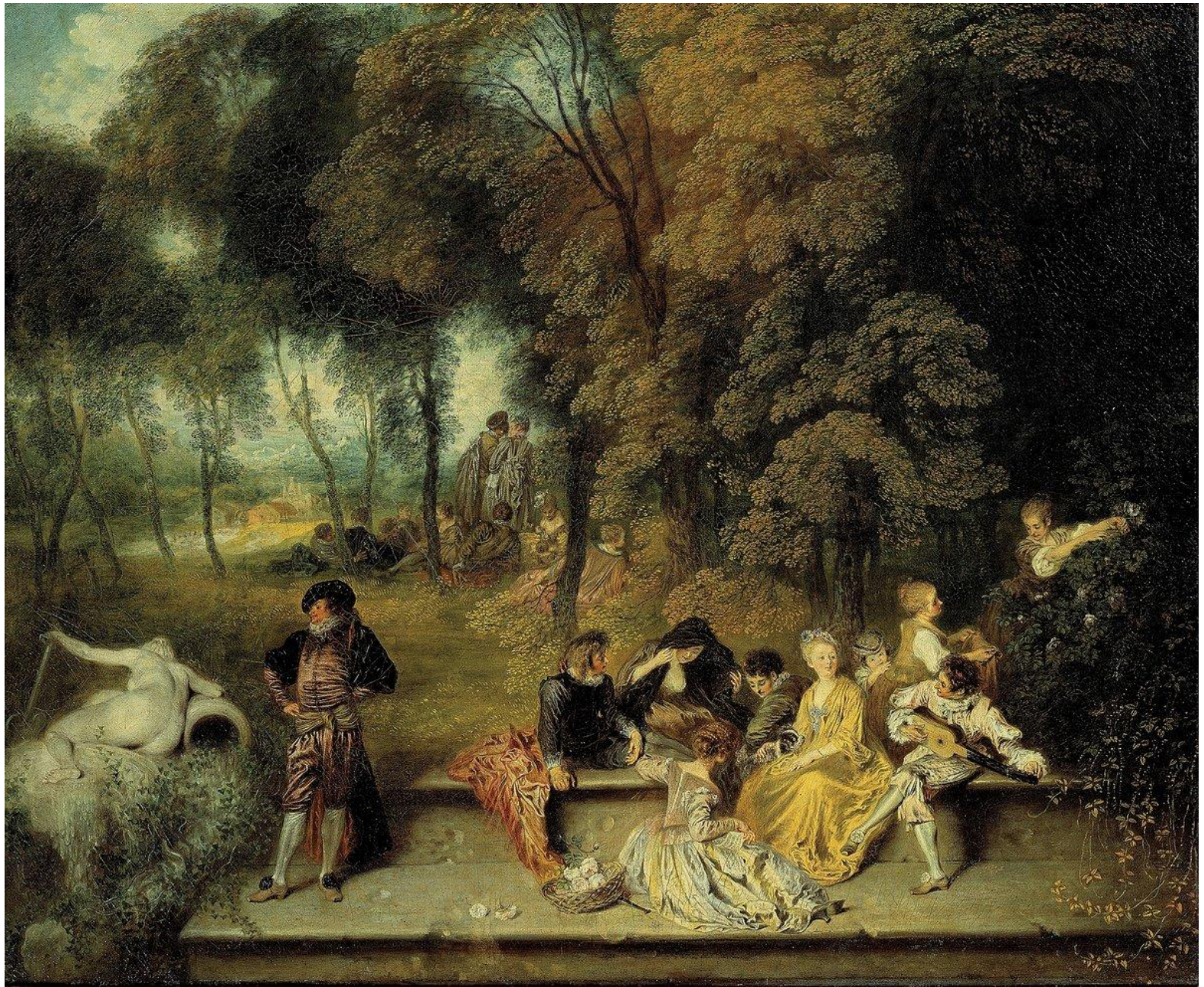
«Общество в парке»