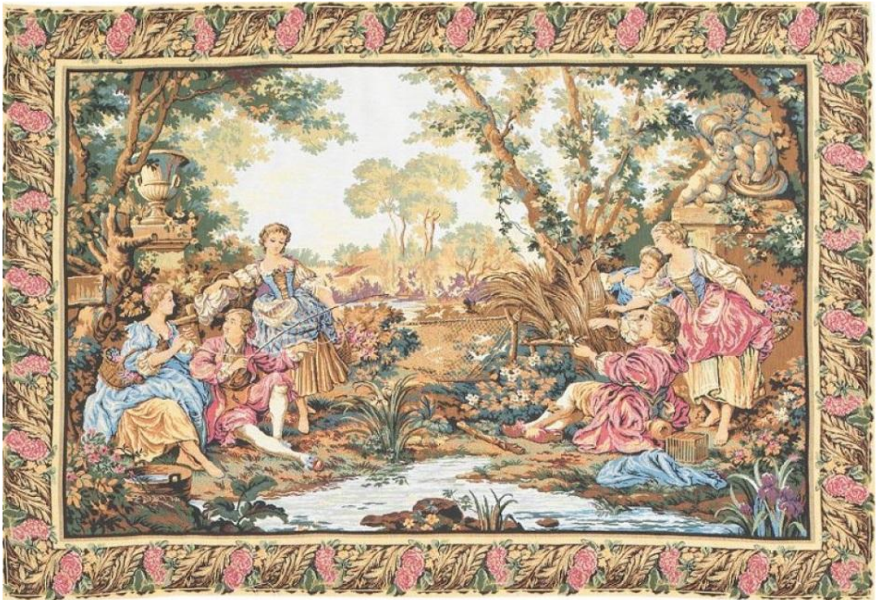
Гобелен по картонам Франсуа Буше