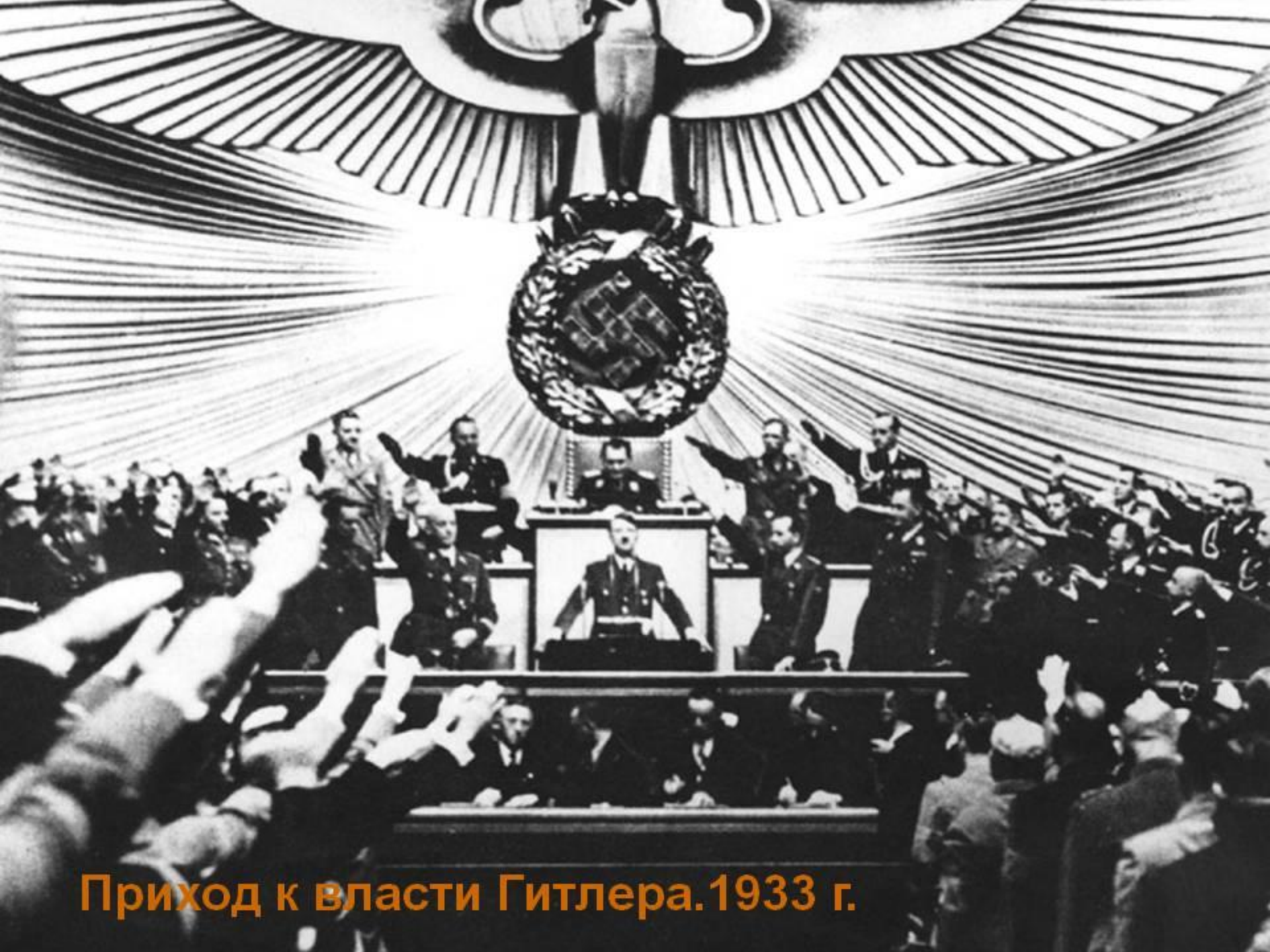
Приход к власти Гитлера. 1933 г.