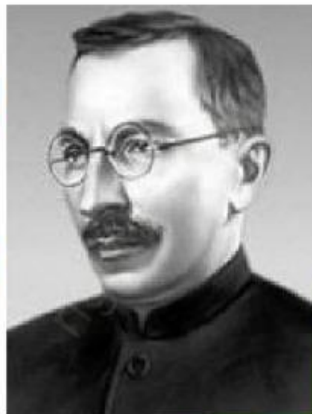
А. С. Макаренко.

Поэтому и в воспитательной работе труд должен быть одним из самых основных элементов.