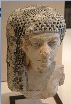
Дочь Нефертити (18 династия Египта)

Скульптура — вырезаю, высекаю — ваяние, пластика — вид изобразительного искусства, произведения которого имеют объёмную форму и выполняются из твёрдых или пластических материалов — в широком значении слова, искусство создавать из глины, воска, камня, металла, дерева, кости и других материалов изображение человека, животных и иных предметов природы в осязательных, телесных их формах