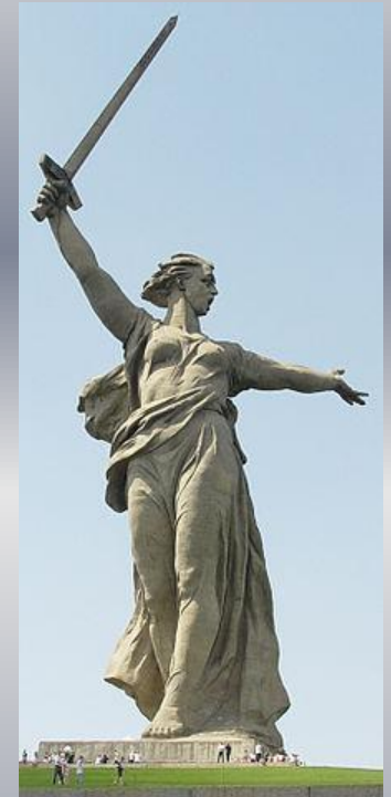
Бетонная скульптура Родина-мать