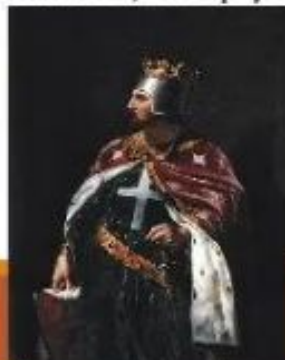
Ричард I Львиное Сердце