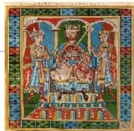
Фридрих I Барбаросса