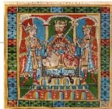
Фридрих I Барбаросса