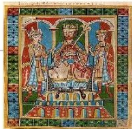
Фридрих I Барбаросса