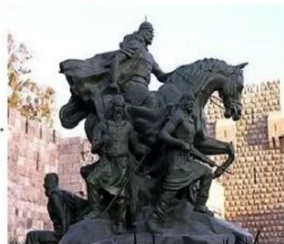
Султан Салах ад-Дин