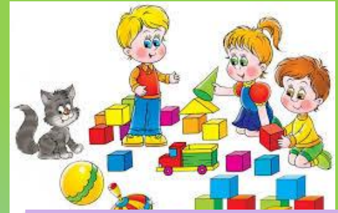
КОНСТРУИРОВАНИЕ ИЗ РАЗНЫХ МАТЕРИАЛОВ