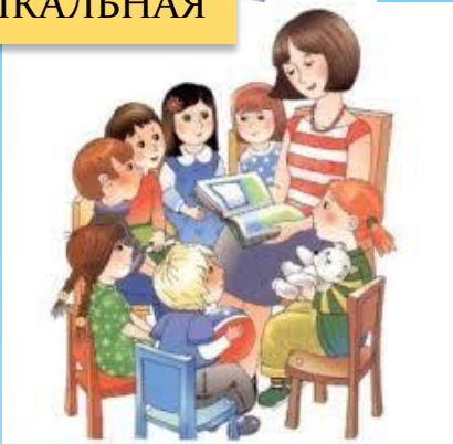
ЧТЕНИЕ ХУДОЖЕСТВЕННОЙ ЛИТЕРАТУРЫ