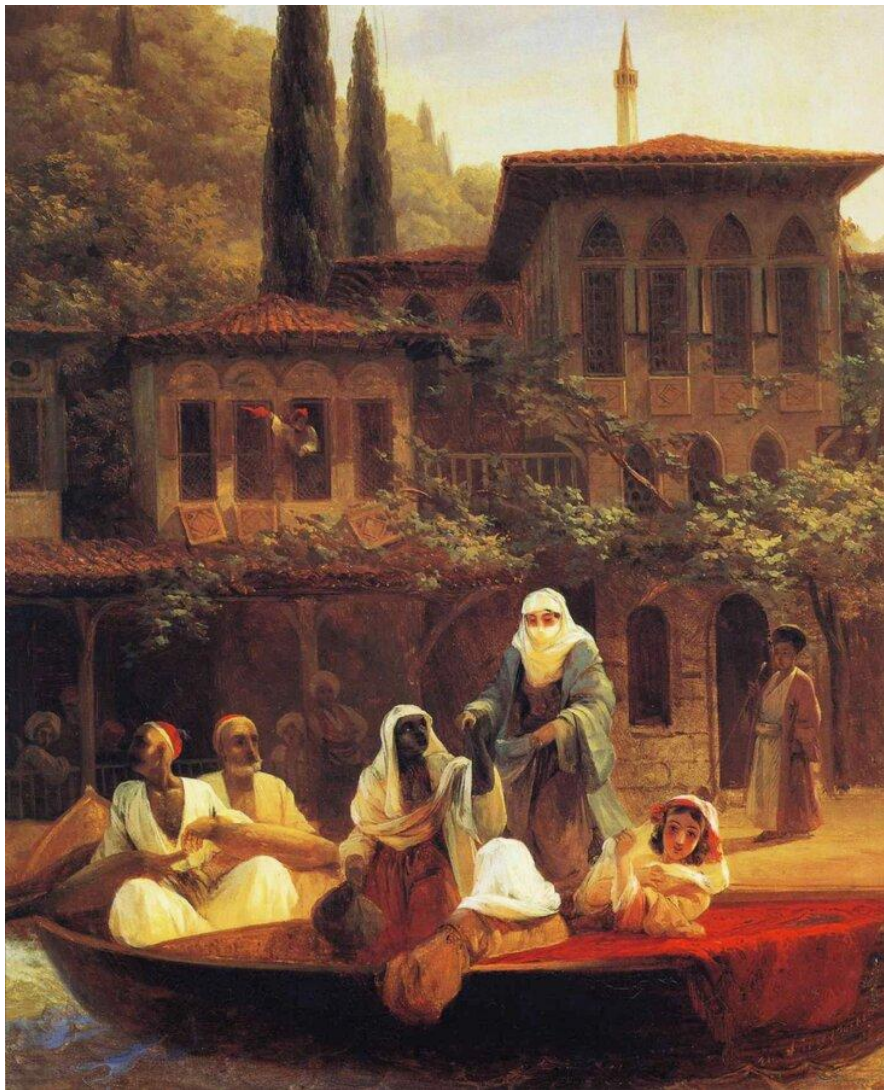
“На лодке по Кумкапы в Константинополе”