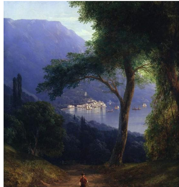
“Вид из Ливадии”

О его морских пейзажах знают даже пятиклассники, а вот о картинах, которые он писал, вдохновившись востоком, не знают даже некоторые интеллектуалы.