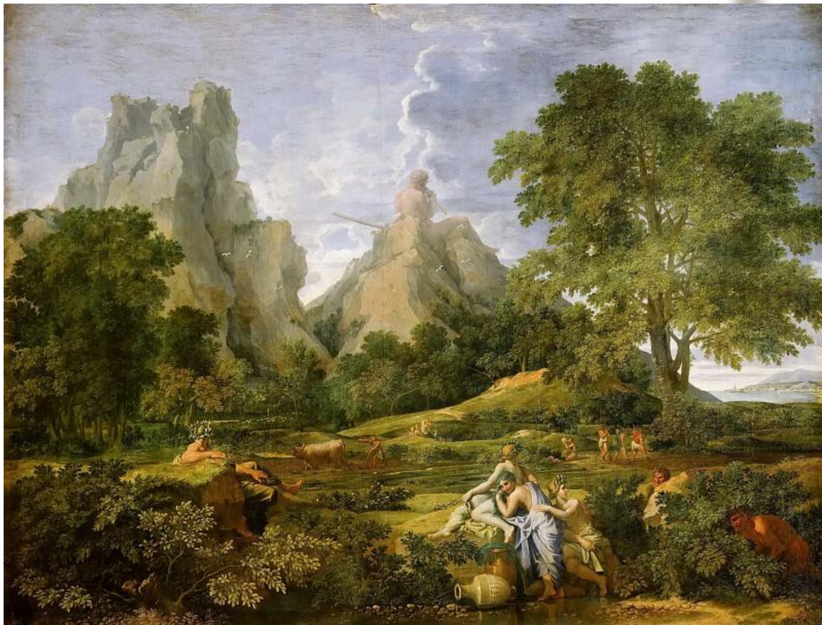
“Пейзаж с Полифемом”