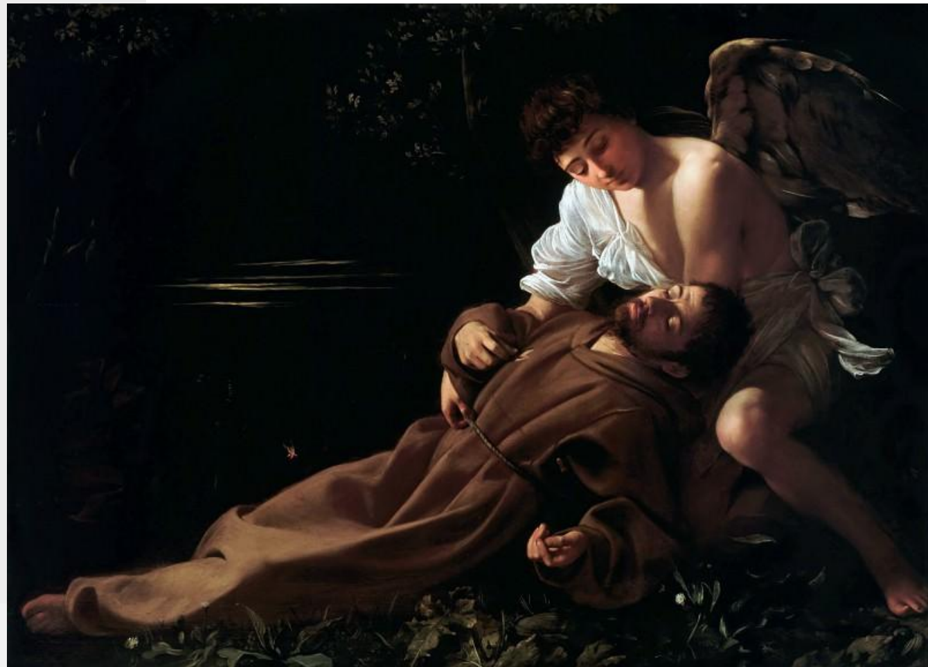
“ Экстаз святого Франциска Ассизского ”