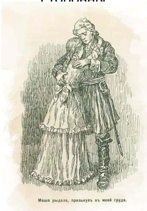
Маша рыдала, прильнув к моей груди.

Частная тема – любовь и верность Петра Гринева и Маши Мироновой, Ивана Кузьмича и Василисы Егоровны