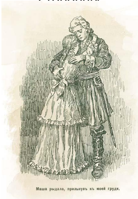
Маша рыдала, прильнув к моей груди.

Частная тема – любовь и верность Петра Гринева и Маши Мироновой, Ивана Кузьмича и Василисы Егоровны