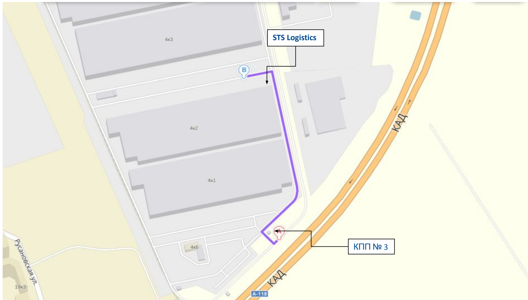
Схема движения ТС по территории РЦ