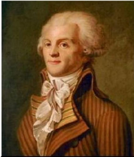
Максимилиан Робеспьер 1758-1794

1793 г. – конституция – Франция - республика