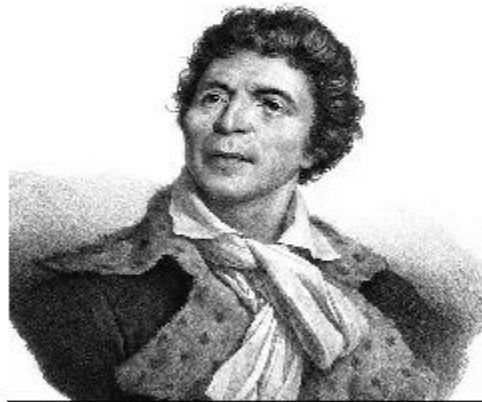
Жан Поль Марат 1743-1793