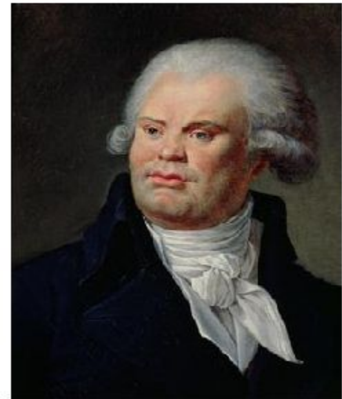
Жорж Жак Дантон 1759-1794