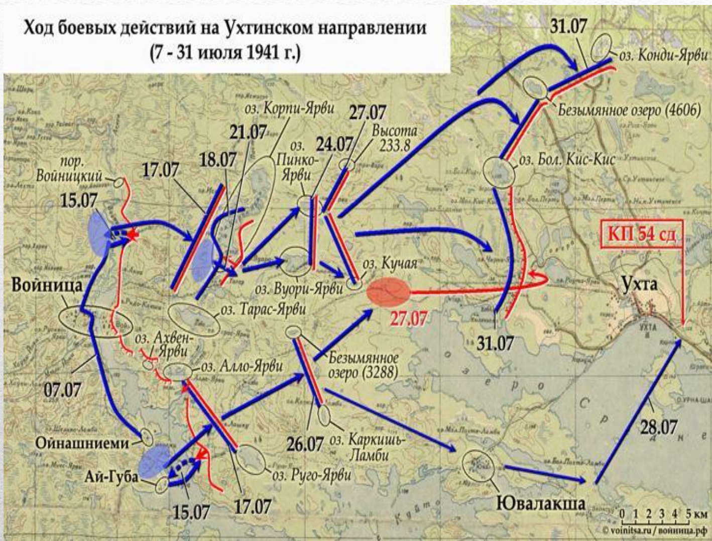
Ход боевых действий на Ухтинском направлении (7 - 31 июля 1941 г.)