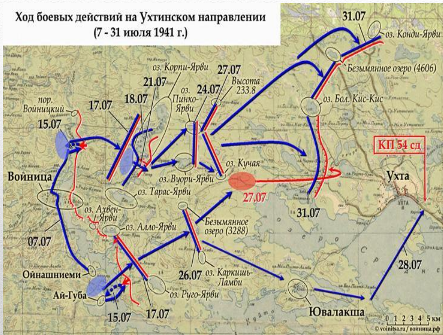
Ход боевых действий на Ухтинском направлении (7 - 31 июля 1941 г.)