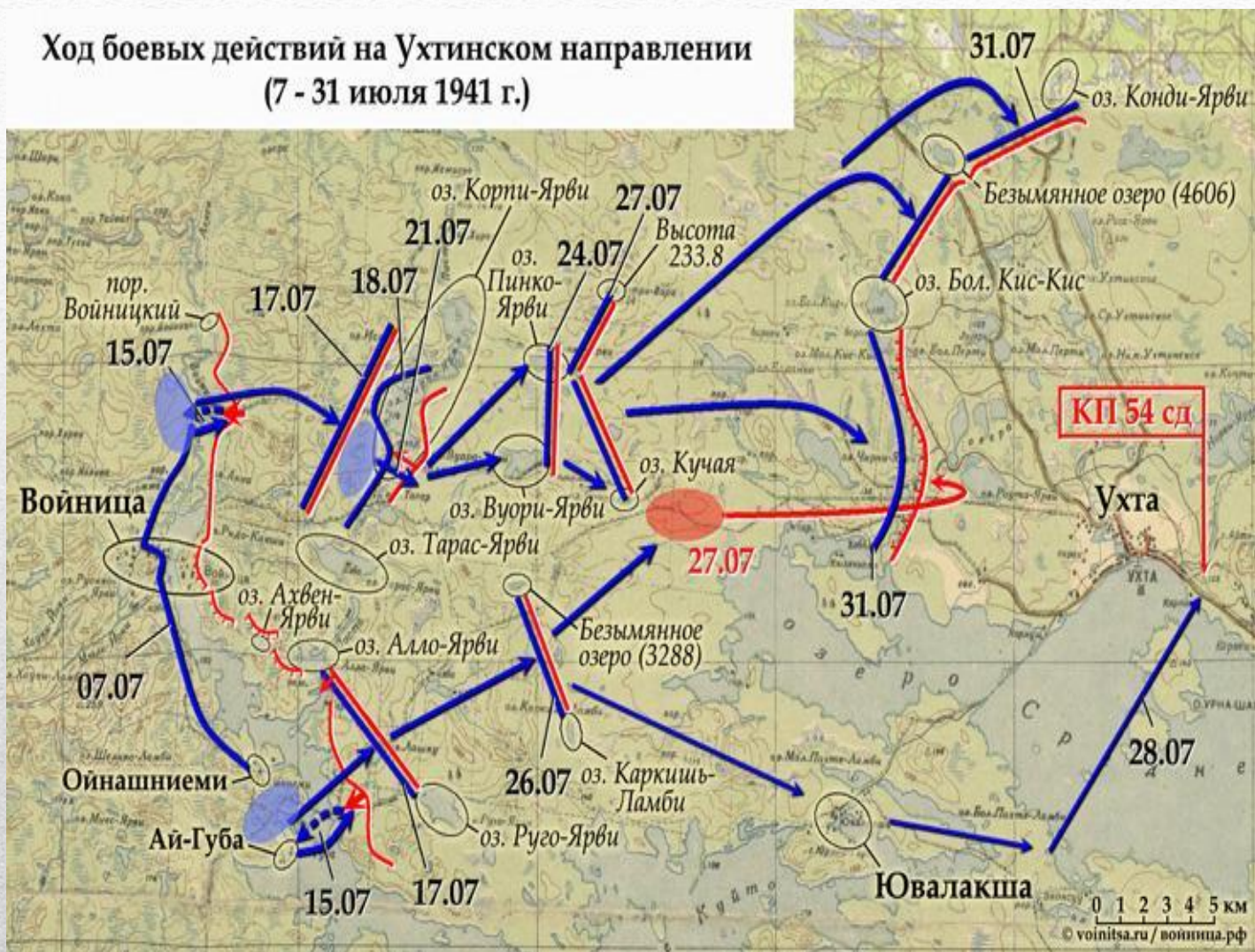
Ход боевых действий на Ухтинском направлении (7 - 31 июля 1941 г.)