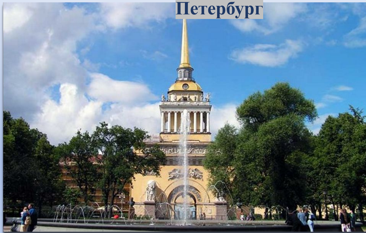
Здание Адмиралтейства, Петербург