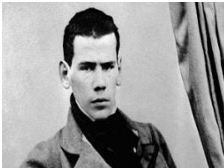
Лев Николаевич Толстой 9 СЕНТЯБРЯ 1828 – 20 НОЯБРЯ 1910 ГГ.