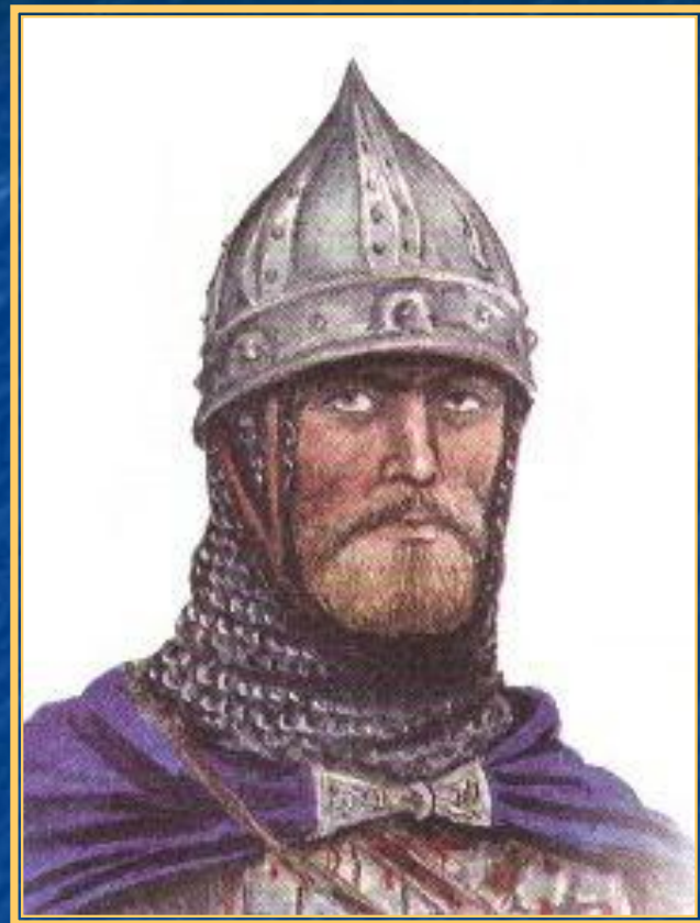
Дмитрий Боброк Волынский

Сам Дмитрий, переодевшись в доспехи простого ратника, стал в ряды воинов большого полка.