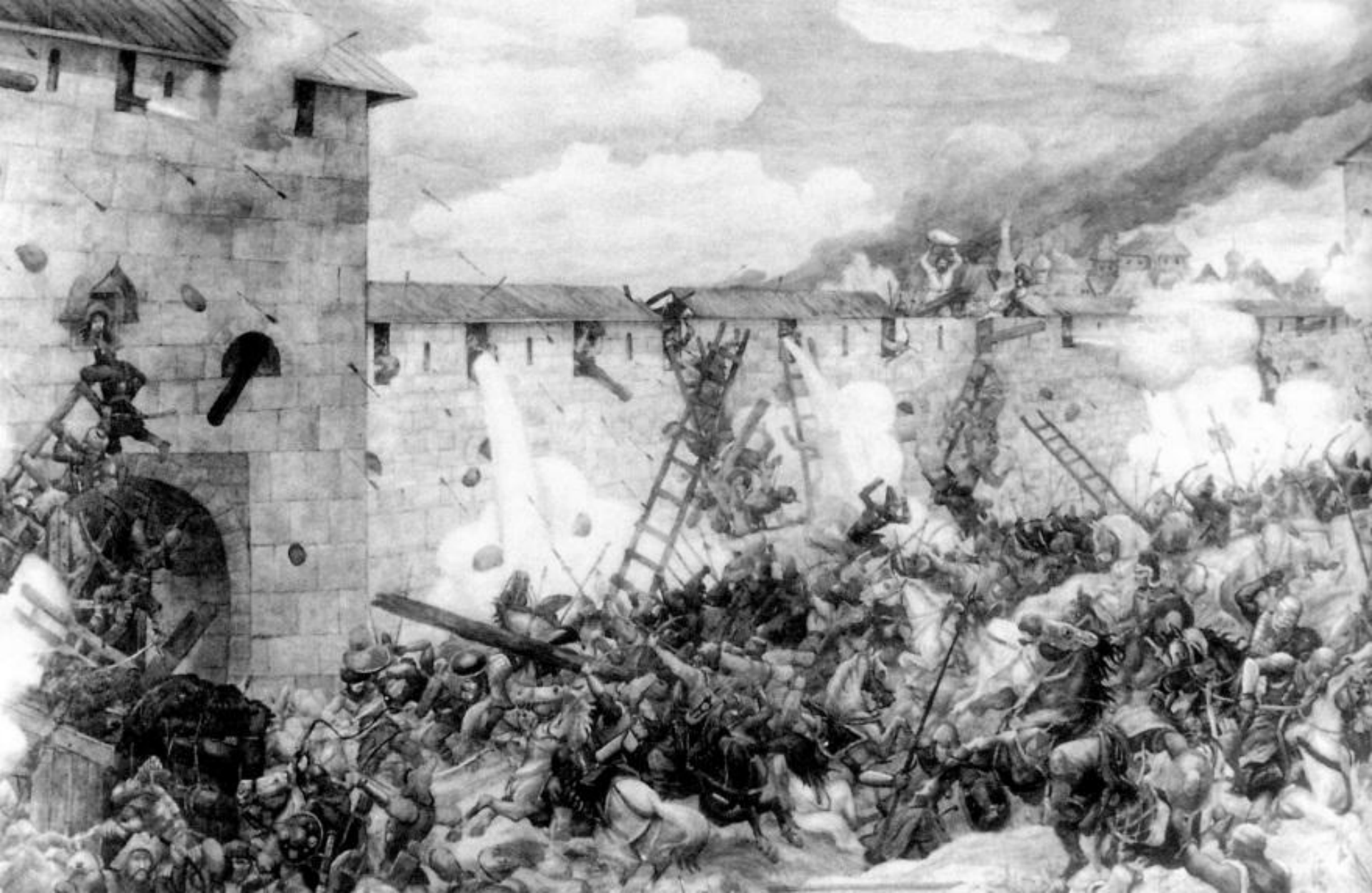
ВОЙСКО ТОХТАМЫША ШТУРМУЕТ МОСКОВСКИЙ КРЕМЛЬ