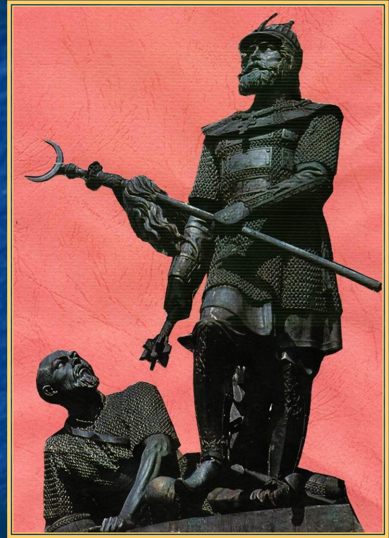
Памятник Дмитрию Донскому