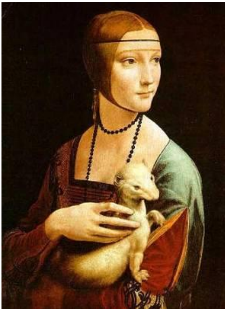
Леонардо да Винчи. Дама с горностаем.

Художники эпохи Возрождения начали рисовать животных с натуры