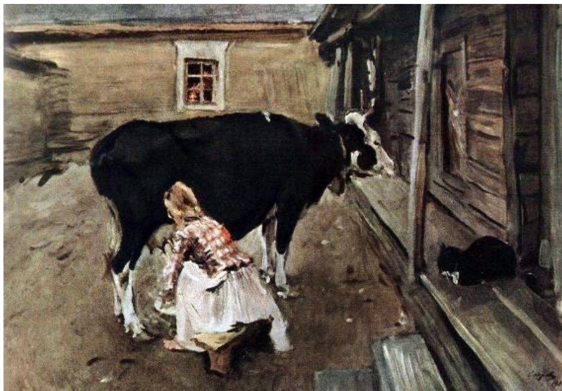
Крестьянский дворик в Финляндии.