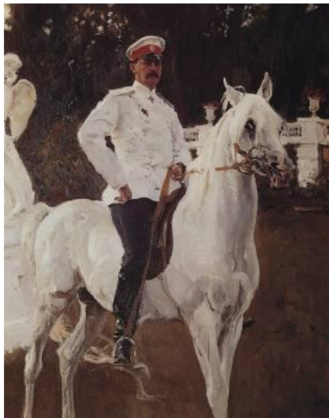
Портрет князя Ф.Ф. Юсупова

В 19 — начале 20 века наряду с романтическим восхищением силой и ловкостью зверя определяется стремление к точному изучению животных (В.А. Серов в России)