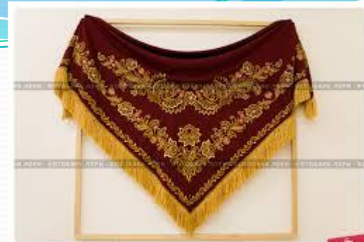
Вышитый узором эмальский платон