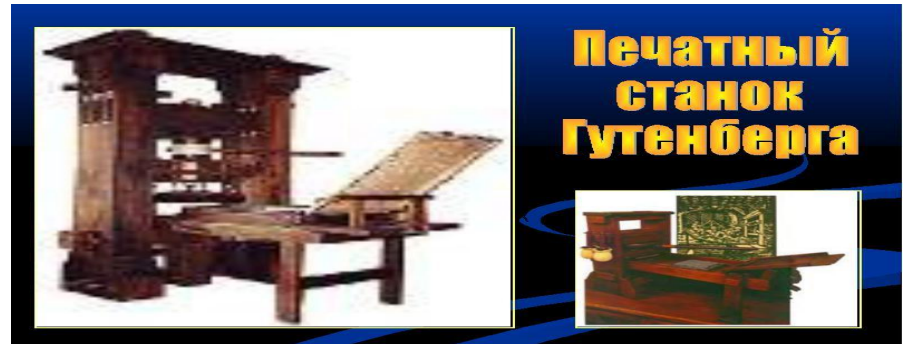
Печатный станок Гутенберга